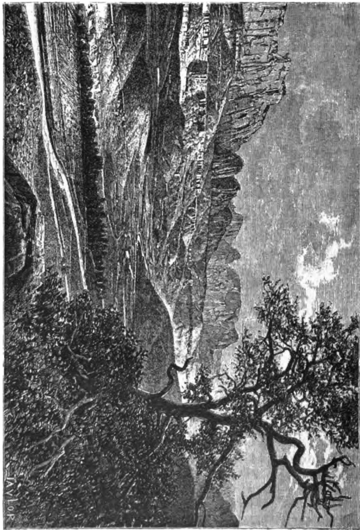
Видъ Скалистыхъ горъ въ штатѣ Юта.

имѣли никакихъ необходимыхъ къ тому свѣдѣній и послѣ продолжительныхъ и бесполезныхъ снованій пзъ стороны въ сторону должны были