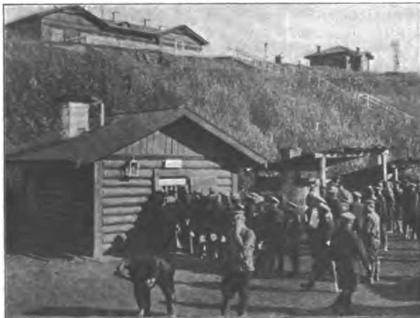
За кипяткомъ на Сибирской жел. дорогѣ.

Въ Петропавловскѣ, бойко отстраивающемся городкѣ, стоящемъ на широкой рѣкѣ Ишимъ, притокѣ Иртыша, уже видимо проявилось заселеніе евреями, выстроившими для себя большую въ два этажа модельню (синагогу), видимую издалека.