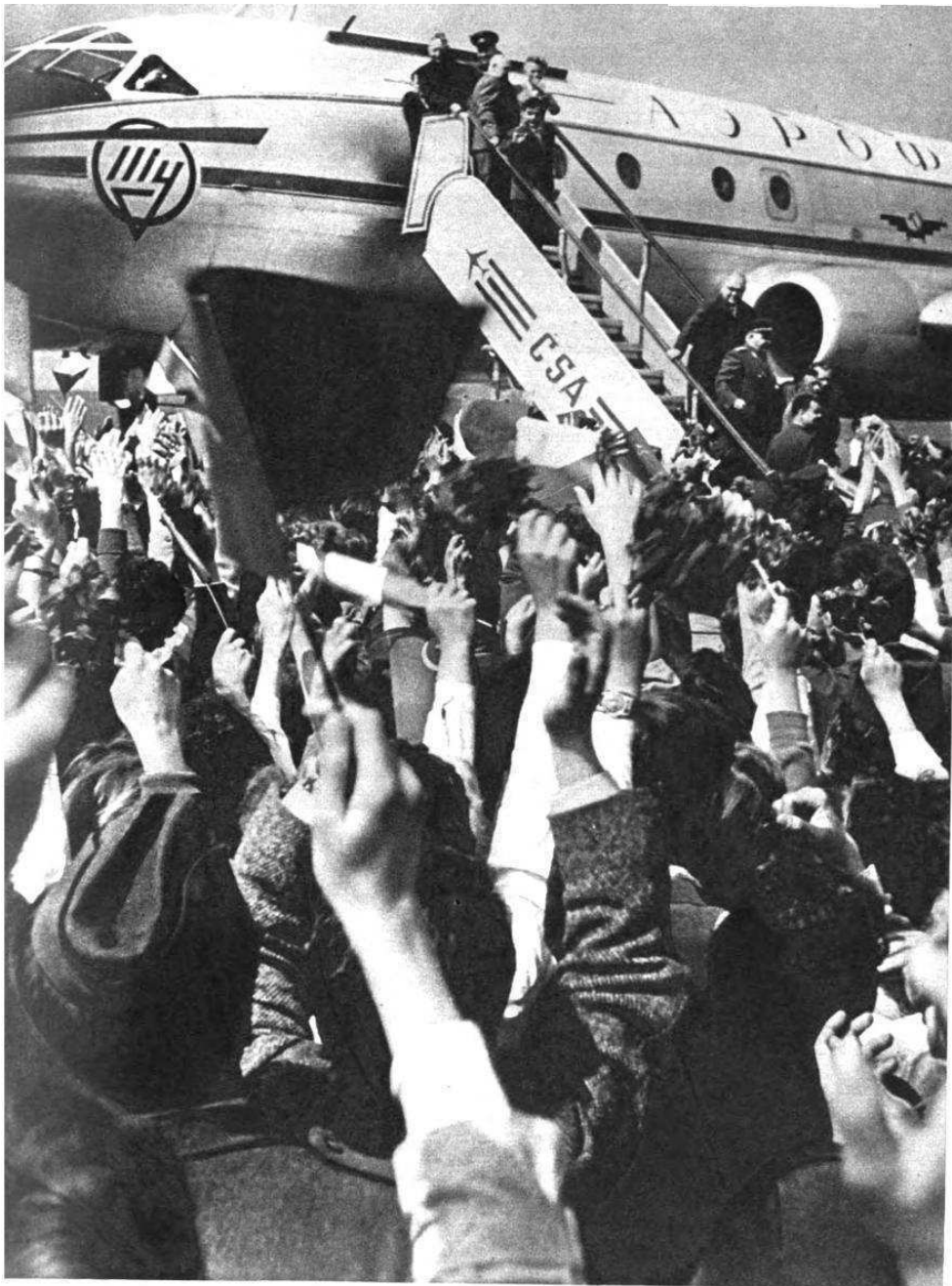
«Руки выразили все». Этот снимок прислан Ю. А. Гагарину из Праги.