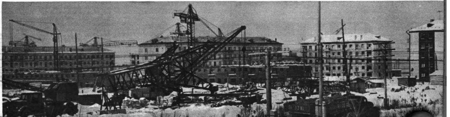
Четыре с половиной года назад на этом месте белели палатки. А теперь здесь кварталы города. Поселок растет, он рад принять каждого, кто решил строить Запсиб.