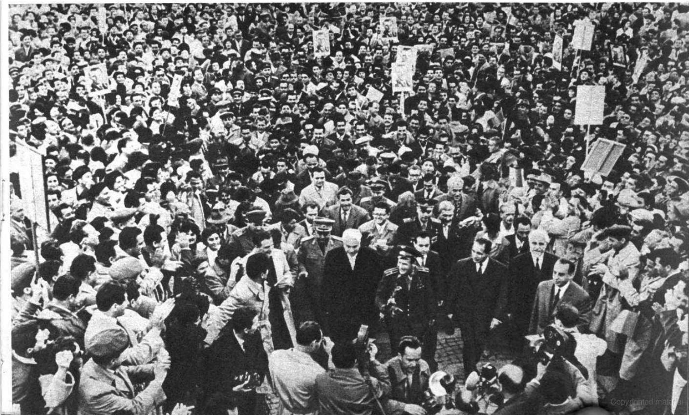
Бухарест встречает Г. С. Титова.

В начале нашего репортажа мы сравнивали неиссякаемый поток писем космонавтам с океанским прибоем. Но нет, это не прибой, это светлая буря, идущая сквозь сердца и души миллионов. Говорят, что до сих пор было 230 названий особенно сильных и постоянных ветров, ураганов и бурь, пронесшихся по нашей планете. И мы узнали еще одну бурю, родившуюся солнечным утром 12 апреля. Она охватила все человечество, она радует всех, она продолжается.