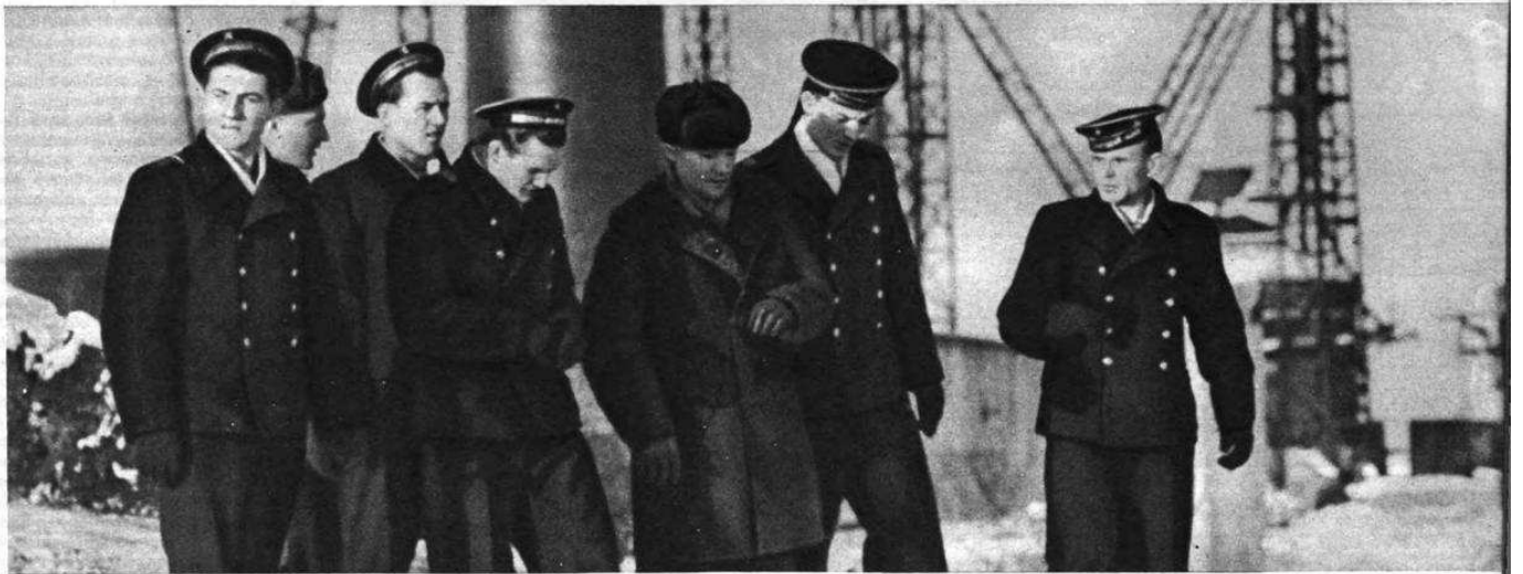
А на стройку все едет и едет народ. Десятиклассники, воспитанники школ ФЗО и училищ, войны, демобилизованные из армии... Приехали и моряки Северного флота. Сибирь зовет!