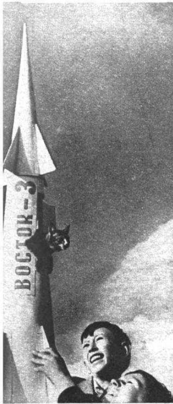
Этот снимок прислан Герману Титову из Горького.