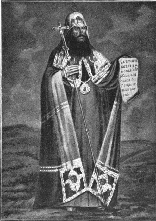
Святѣйшій патріархъ Никонъ.

клубука съ херувимами или двухъ панагій, преднесеніе креста, названіе Воскресенскаго монастыря Новымъ Іерусалимомъ и пр. Никонъ съ презрѣніемъ и ироніей отвѣчалъ