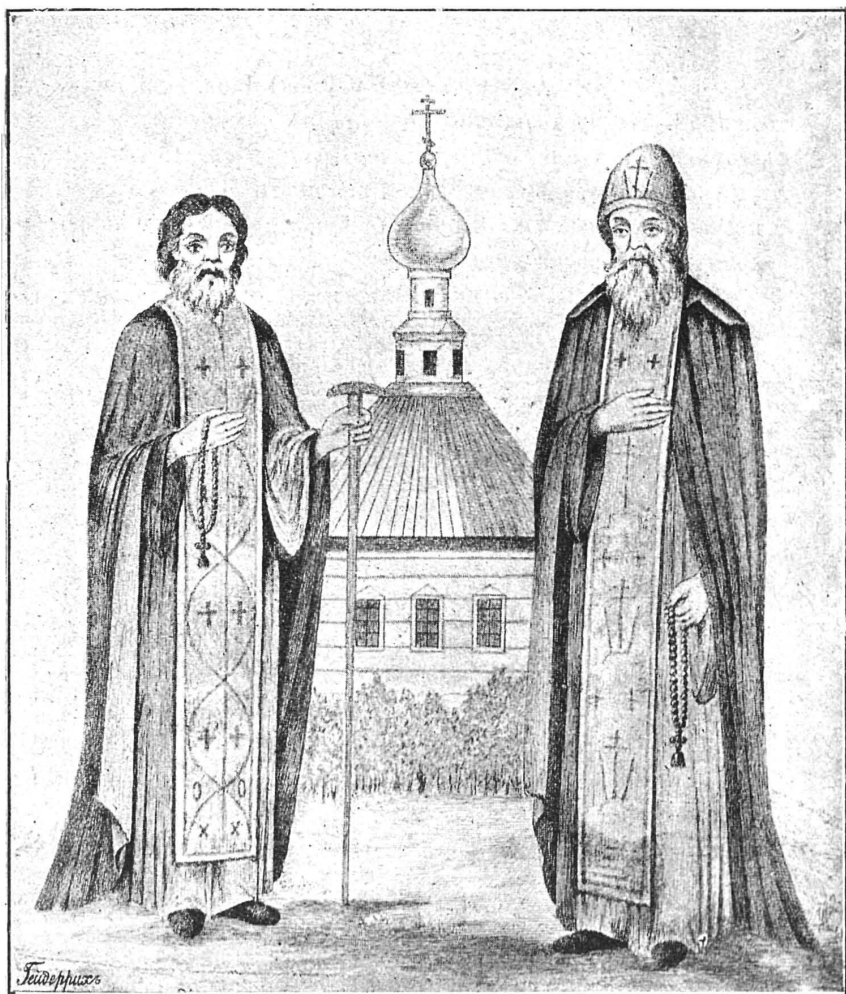
Преподобные Авраамій и Серапионъ.