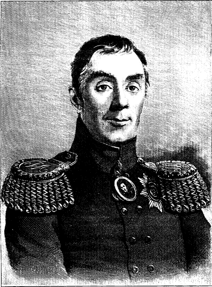
Графъ Алексѣй Андреевичъ Аракчеевъ.

Съ литографіи, сдѣланной съ портрета, находящагося въ «Возной газетѣ» Злинскаго двора.