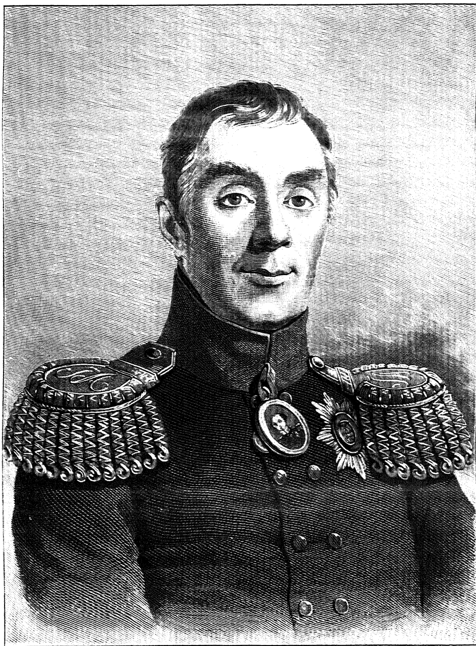
Графъ Алексѣй Андреевичъ Аракчеевъ.

Съ литографіи, сдѣланной съ портрета, находящагося въ «Воеиной галереѣ» Зимняго дворца.