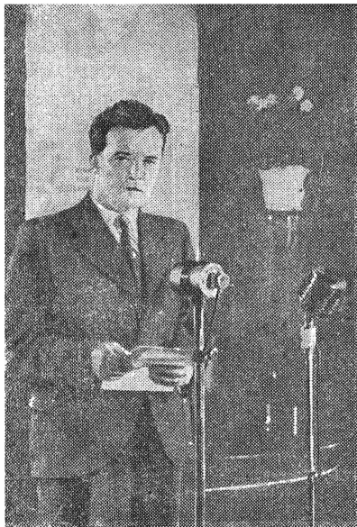
Председатель Всесоюзного комитета по делам физкультуры и спорта при СНК СССР Н. Н. Романов выступает на открытии радиоматча

Наконец был зафиксирован конкретный срок проведения матча — с 1 по 4 сентября, — и обе стороны обменялись списками своих команд.