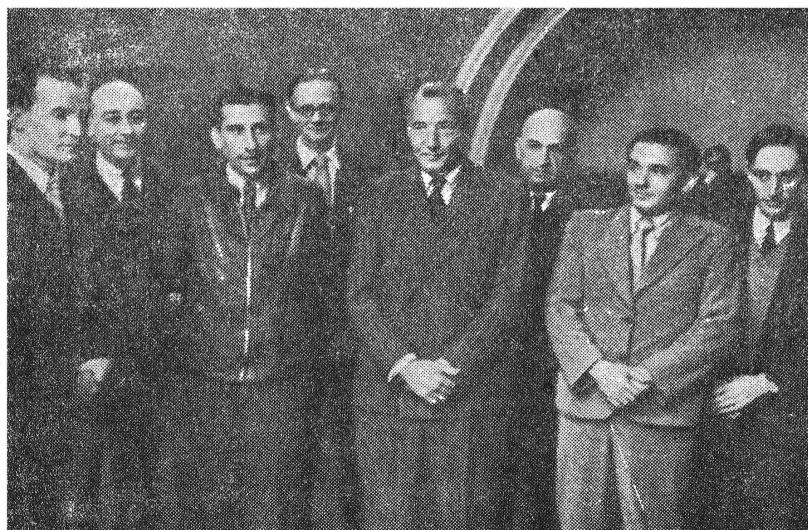
Посол Великобритании господин А. Керр (в центре) среди участников и организаторов радиоматча