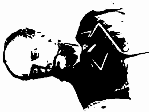
Секретарь Ворон. Статист. Комитета въ 1870 х гг. Портретъ снятъ въ 1880 г.