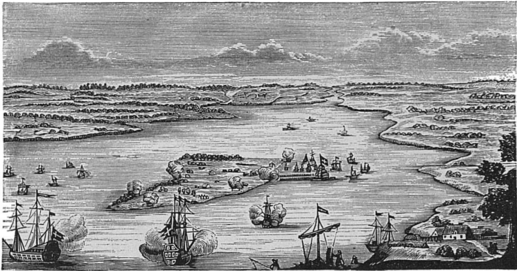
Первоначальный видъ Петербурга. Съ гравюры прошлаго столѣтія Боденера.

однажды, что дерево, къ которому онъ привязывалъ свой челнокъ, вырвано бурей; желая прикрѣпить челнъ къ корнямъ дерева, онъ замѣтилъ, что земля подъ нимъ подмыта и унесена волнами; вглядываясь, онъ пораженъ былъ изумленіемъ, увидѣвъ вдругъ множество серебряныхъ монетъ; при осмотрѣ, онъ увидѣлъ, что здѣсь была заопана бочка денегъ и дерево посажено надъ нею, какъ знакъ для отысканія. Дважды долженъ былъ крестьянинъ возвращаться на своей ладѣ для перевозки клада въ деревню. Скоро о находкѣ провѣдала земская полиція и помѣщица. Крестьянинъ долженъ былъ часть возвратить, и отдать семь пудовъ серебра, оставивъ, вѣроятно, при себѣ болѣ-