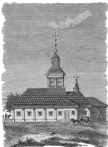
Первоначальный видъ Троицкаго собора въ Петербургѣ.

Враловцина деревня, у Прачечнаго моста въ нынѣшнемъ Лѣтнемъ саду—Парвушина или Кононова мыза и т. д. Существующій теперь перевозъ отъ Смольнаго на Большую Охту остался неизмѣннымъ съ 1676 года. Извѣстно, что русскій языкъ былъ довольно распространенъ во время шведскаго владычества: король учредилъ даже въ Стокгольмѣ русскую типографію, съ цѣлью печатать и распространять между православными жителями Кареліи и Ингерманландіи лютеранскія духовныя книги