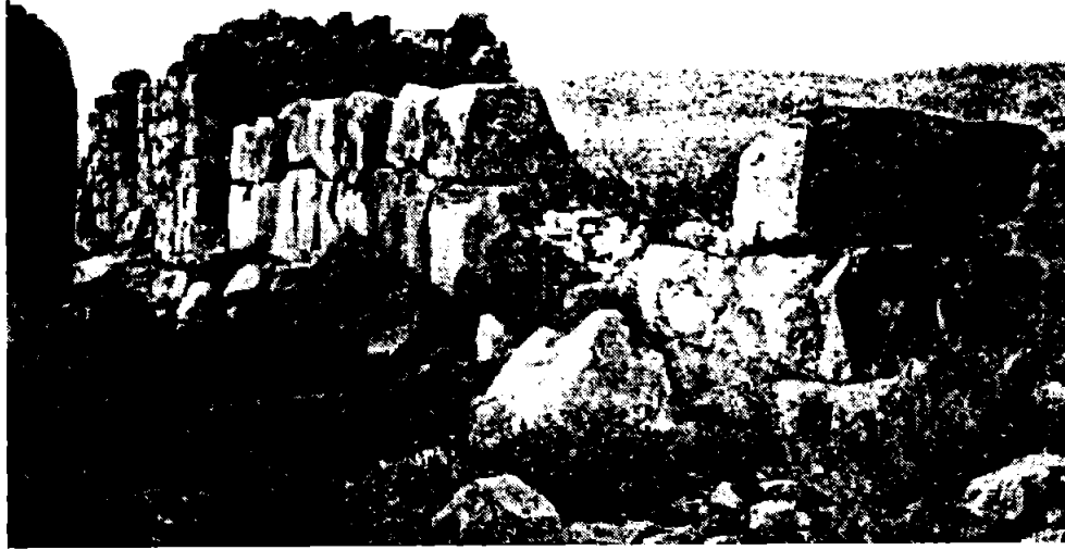
Рис.2. Остатки циклопических стен, открытие в 1884 году Шлиманом в Арголиде, относимые к Микенской эпохе и с нашей точки зрения одновременные эпохе Египетских пирамид.