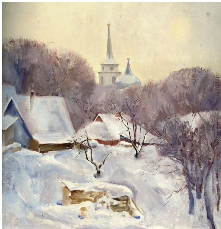
«Зима в Абрамцево. Церковь». 1886 год. Холст, масло, 20×15 см. Государственный Русский музей, Санкт-Петербург

Фигура женщины органично выступает из темного фона. Свет, падающий из окна, освещает ее фигуру и лицо. На этом портрете мы не видим взгляда девушки — ее глаза слегка опущены. Художник словно не хочет раскрывать тайну, которая скрывается в этих глазах.