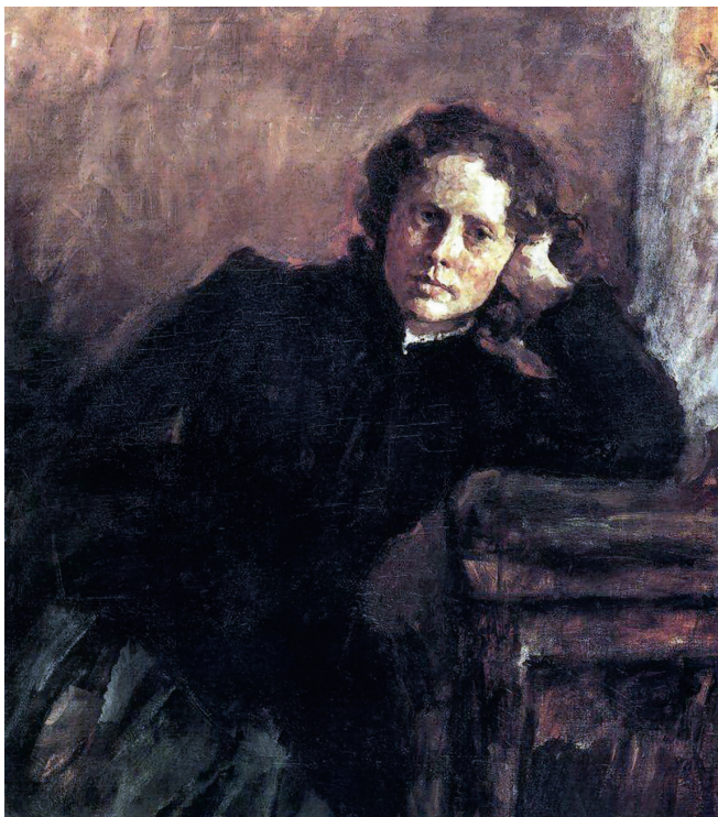
«У окна». 1886 год. Холст, масло, 99×70 см. Государственная Третьяковская галерея, Москва