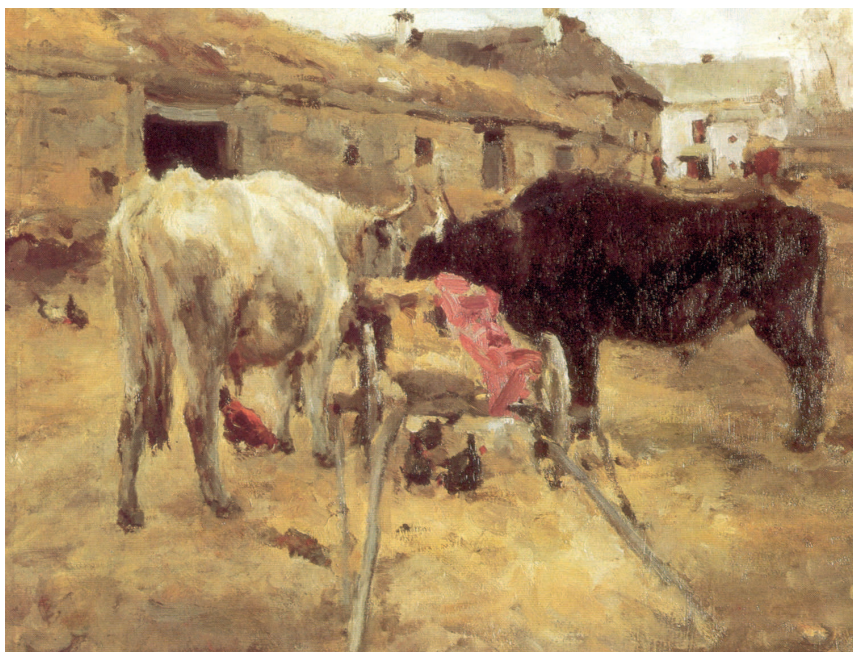
«Волы». 1885 год. Холст, масло, 47×59 см. Государственная Третьяковская галерея, Москва

Серов впоследствии еще не раз обращается к деревенской теме, но, в отличие от своих предшественников — передвижников 1860-х годов, он не стремится обличать неспра-