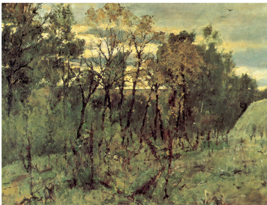
«Осенний вечер в Домотканово». 1886 год. Холст, масло, 56,7×72 см. Государственная Третьяковская галерея, Москва