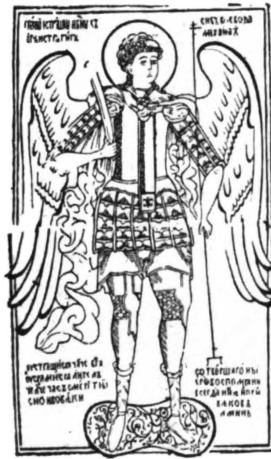
21. Михаил Архангелъ. народная картинка конца XVII в.