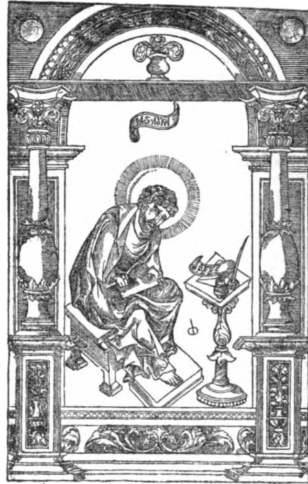
2. Евангелистъ Лука, изъ первопечатнаго Московскаго Апостола 1564 года.

царскому повелѣнію въ Москвѣ, книгѣ Апостолъ 1564 года (2); за ней слѣдо-