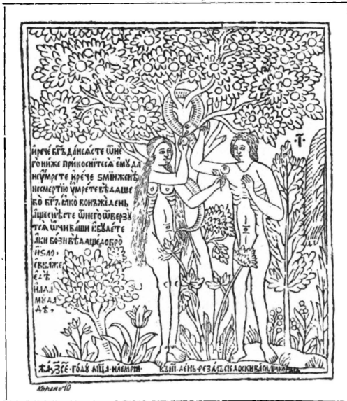
18. Картинка изъ Библии, работы Кореня 1696 г.