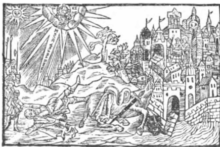
16. Обращеніе Павла, изъ „Библии“ монаха Илія, 1645—49 г.

Гравированіе на мѣди, въ противоположность гравированію на деревѣ, съ самаго начала своего сдѣлалось достойнѣмъ искусства, какъ на Западѣ, такъ и у насъ. Уже въ первой половинѣ XVI вѣка оно стало, и въ Германіи, и въ Италіи, и въ Нидерландахъ, на высокую степень совершенства, такъ какъ въ то время не