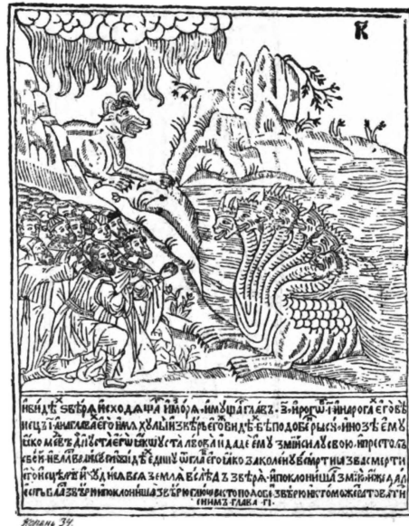
19. Изъ Апокалипсиса, работы Кореня 1696 г.

только граверы по ремеслу, но и почти всѣ знаменитые живописцы занимались гравированіемъ на мѣди, — одни крѣпкой водкой, а другіе и рѣзцемъ. Первый памятникъ этого искусства у насъ — доска для красиваго заглавнаго листа къ «Ученію о ратномъ строѣ» сдѣлана по царскому