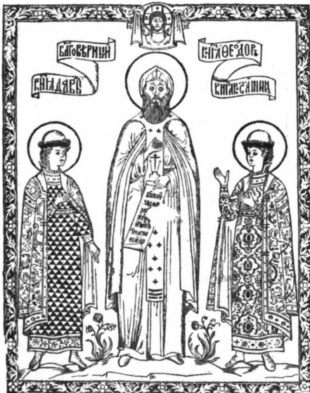
20. Ярославскіе святые: князя Феодоръ, Давидъ и Константинъ. Образчикъ народныхъ картинокъ, рѣзанныхъ на деревѣ въ концѣ XVII вѣка.

Первыми русскими граверами были знаменщики или рисовальщики Серебряной Палаты, составлявшей отдѣленіе Оружейной Палаты въ Москвѣ. Эти знамен-