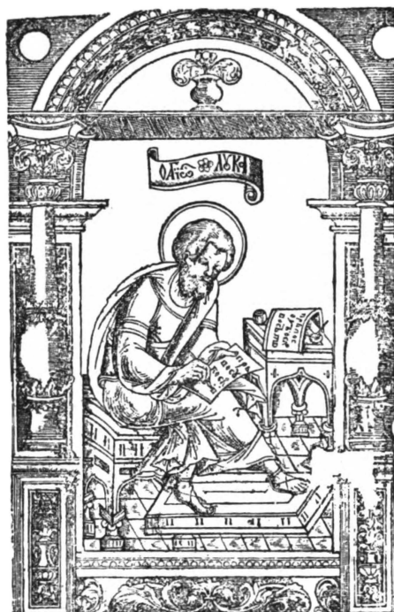
3. Евангелист Лука из Львовского Апостола 1574 года.