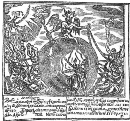
14—15. Пятая картинка изъ „Апокалипсиса“ и „Отче нашъ“, іерея Прокопія 1646—1662 гг.

картинками, гравированными на деревѣ въ XVIII вѣкѣ, должны быть отнесены лицевыя изображенія изъ Библии и Апокалипсиса, рѣзанныя въ 1696 году граверомъ Коренемъ по рисункамъ мастера Григорія (18—19). Съ этого времени, въ продолженіе всего XVIII вѣка, тянется непрерывный рядъ народныхъ картинокъ на деревѣ, такой же топорной работы.