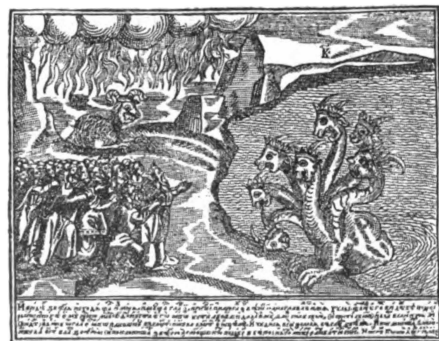
19—13. Четыре картинка изъ „Апокалипсиса“, іерея Прокопія 1644—62 гг.