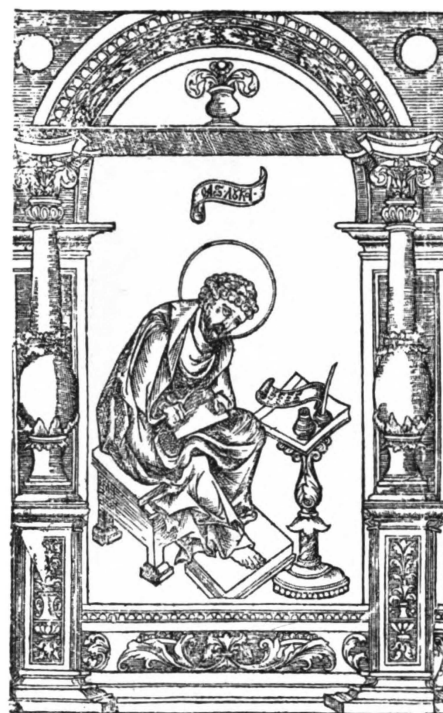
4. Евангелист Лука из Виленского Апостола 1591 года.