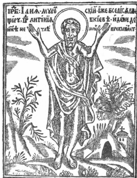
17. Препод. Ілья Муромскій, гравюра Ільи для Печерскаго Патерика 1661 г.