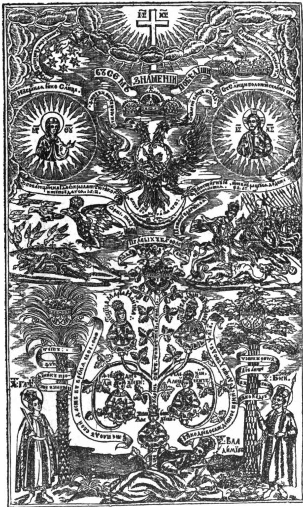
23. Заглавный листъ изъ книги „Мечъ духовный“, Черняговъ 1666 г.