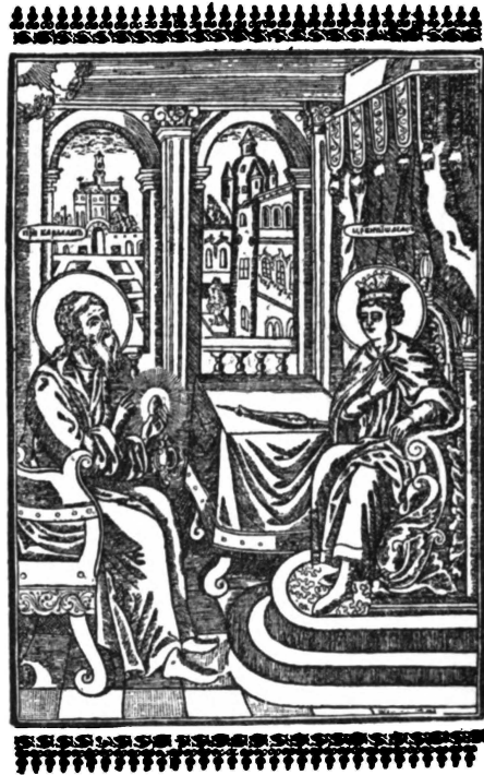
24. Варлаамъ Пустыиникъ я Иосифъ Царевичъ, Клицковная гравюра XVIII в.