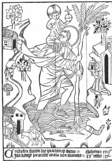
1. Св. Христофоръ, старинная картинка 1423-го года.

1475 г.), разныя легенды о крестѣ, страшномъ судѣ, антихристѣ, лицевыя изобра-