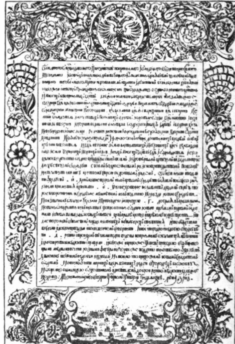
25. Заглавный листъ изъ книги о ратномъ строѣ (М. 1647 г.), гравир. въ Голландіи съ рис. иконописца Благушина.