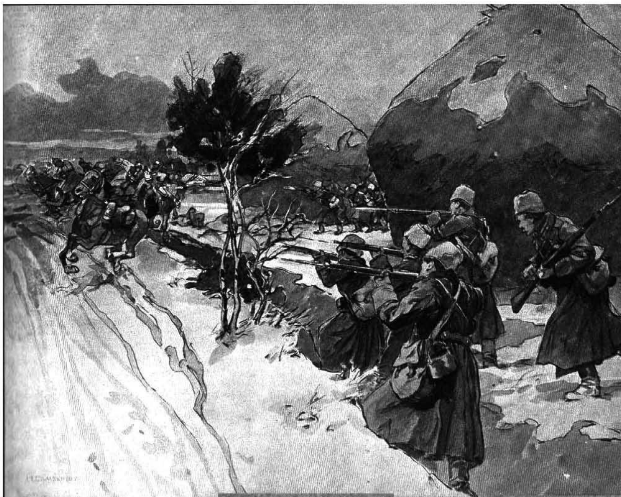
Встрѣча съ германскимъ развѣдомъ.