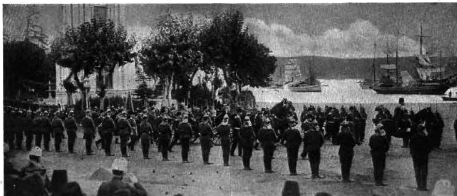
Выглядъ султана въ день объявленія войны.