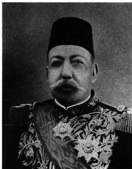
Турецкій султанъ Мехометь V.