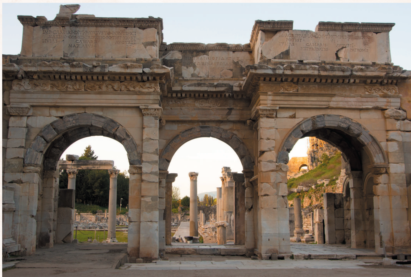
Развалины древнего Эфеса

Павел провел в Эфесе около пяти лет; вместе с ним проповеднической деятель-