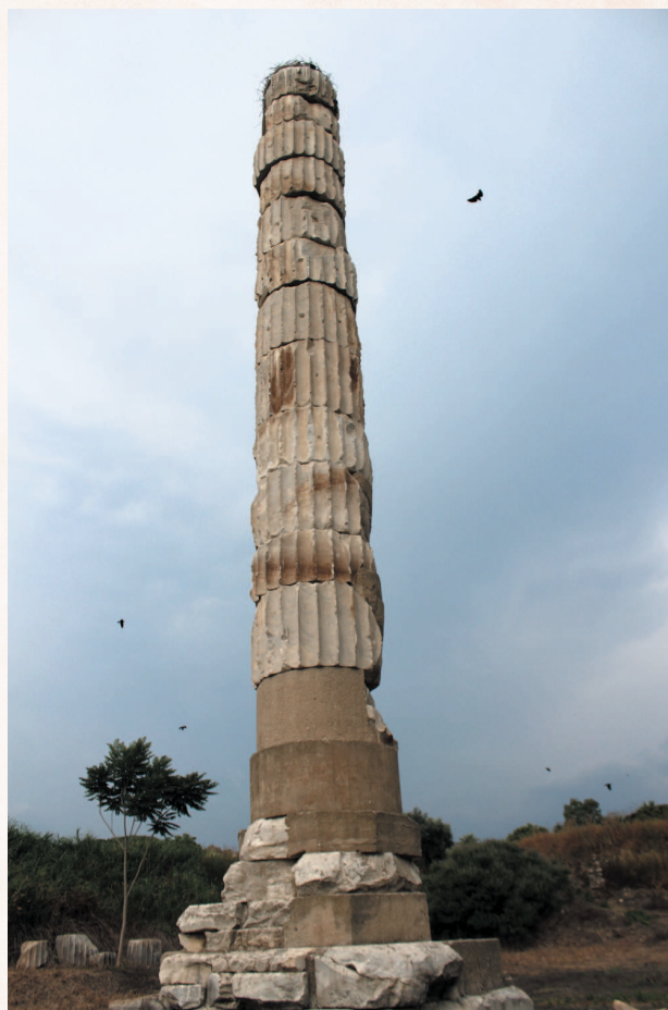
Колонна Храма Артемиды. Все, что осталось от чуда света.

огромный и сильный город, один из важнейших торговых и культурных центров. Теперь – это просто выжженные солнцем земли, на которые каждый день экскурсионные автобусы привозят сотни людей – для того чтобы те могли осознать степень бывшего величия этих мест.