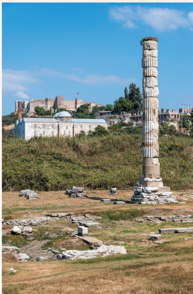
Развалины Храма Артемиды.

Нет ничего удивительного в том, что древние люди обратили внимание на эти земли давным-давно, задолго до того, как здесь был построен храм Артемиды Эфесской.