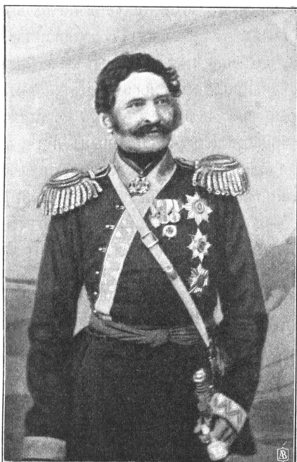
Графъ Л. А. Перовскій.