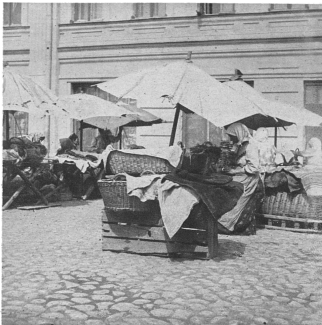
Торговки хлѣбомъ на Смоленскомъ рынкѣ.