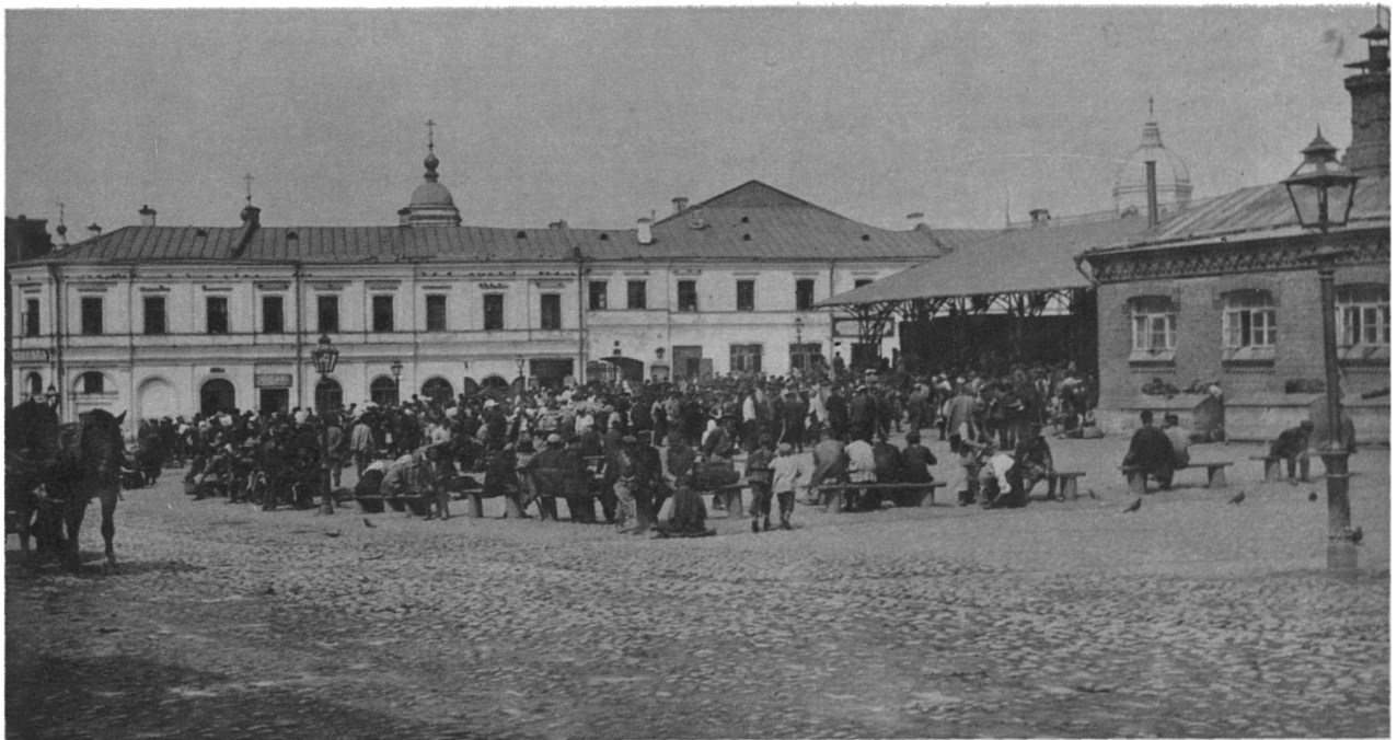
Московская жизнь. Хитровъ рынокъ.