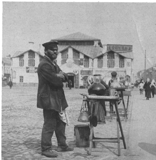
Продавецъ кваса и „дуэль“.