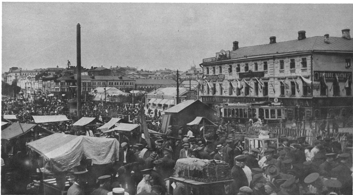
Московская жизнь. Воскресный торгъ на Трубной площади.