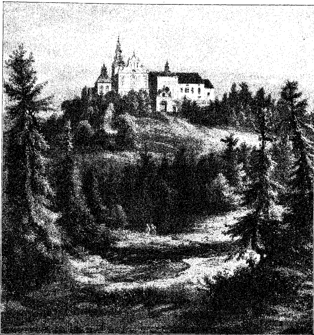
Костелъ Св. Креста на Лысой горѣ.

Закрочима (около Новогеоргиевска),—Висла залила почти всю равнину между Варшавой, Новогеоргиевскомъ и м. Эгеръ, такъ что между Варшавой и Новогеоргиевскомъ, было прервано сообщеніе на нѣсколько недѣль. Еще значительнѣе были разливы 1845 года. Ночью съ 19 на 20 марта, между Пулавами и Моржице тронулся ледъ; заторъ, образовавшійся между Морд-