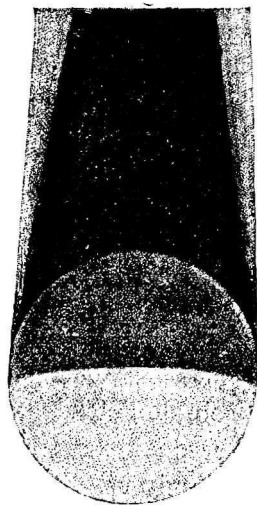
Рис. 1. — Ночь и день.

Вотъ почему, поднявшись мысленно въ любой часъ ночи надъ землею поверхностью, мы, вмѣсто того чтобы оставаться подъ ночнымъ покровомъ, увидимъ Солнце, излившающееся въ пространство волны своего свѣта. Если мы поднимемся къ одной изъ планетъ, движущихся, какъ и Земля, въ той части пространства, гдѣ находимся мы, то мы увидимъ, что почъ Земли не простирается на другіе міры, и что промежутокъ времени, посвященный у насъ покою, не простирается до нихъ своего вліянія. Въ то время какъ здѣсь всѣ живыя существа погружены въ покой молчаливой ночи, тамъ силы природы продолжаютъ проявлять свою блестящую дѣятельность, Солнце свѣтитъ, жизнь кипитъ, движеніе не прекращается ни на мгновеніе, и царство свѣта господствуетъ въ небесахъ (какъ и на противоположномъ нашему полушаріи) въ тотъ самый часъ, когда ночь сковываетъ неподвижностью всѣ существа на томъ полушаріи, на которомъ живемъ мы.