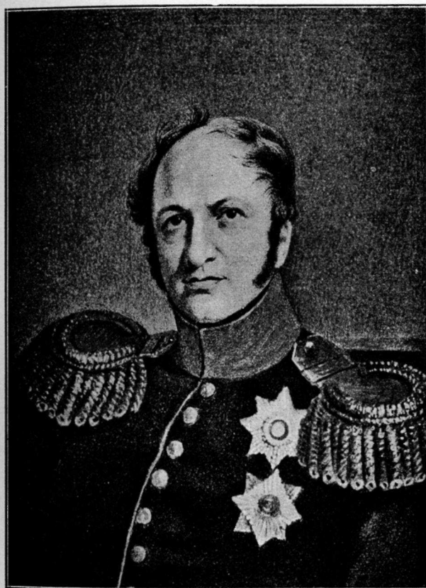
Генераль-отъ-Инфантеріи Графъ Канкрикъ Министръ Финансовъ (1823—1843.)