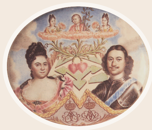
Петр I с семьей

Но царь не забыл прелестницу, и через некоторое время судьба наложницы была решена. Петр I «без всяких формальностей... взял ее под руку и увел в свой дворец. На другой день и на третий он видел Меншикова, но не заговаривал с ним о том, чтобы прислать ему ее обратно. Однако на четвертый день... сказал ему, как бы размышляя: “Послушай, я тебе не возвращу Екатерину, она мне нравится и останется у меня. Ты должен мне ее уступить”. Меншиков дал свое согласие кивком и с поклоном и удалился». Так Екатерина стала любовницей Петра I — его «солдатской женой». Но это еще ничего не значило, и царь поначалу особо ее не выделял.