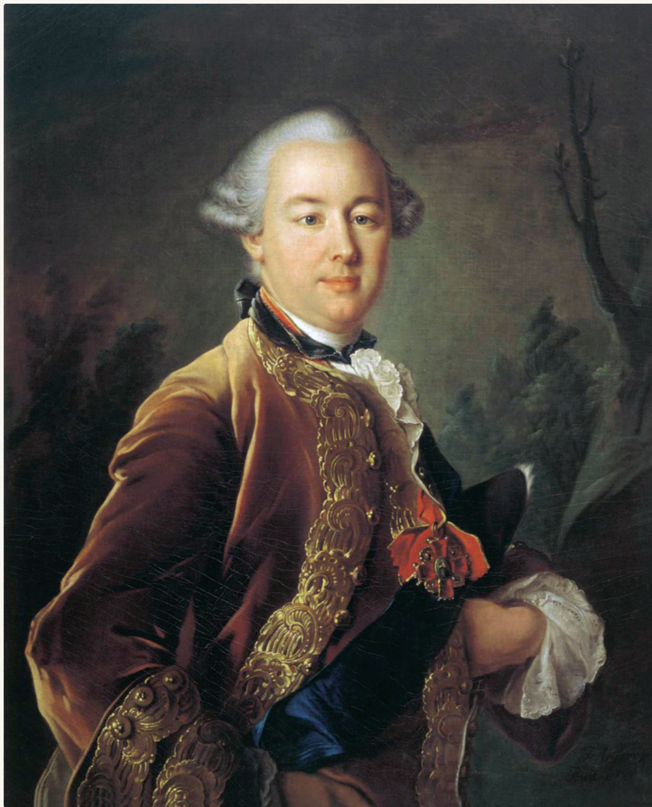
Б. П. Шереметев