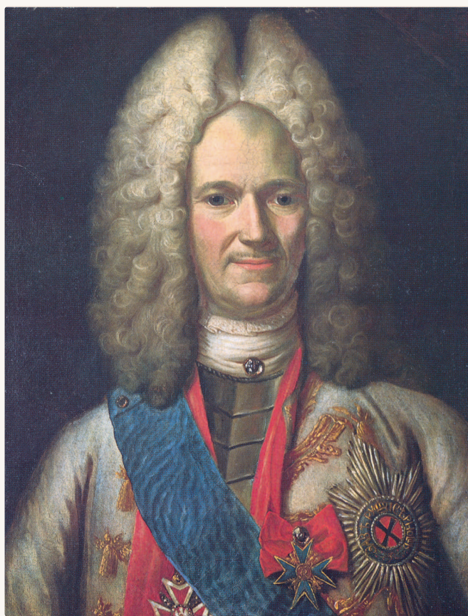
Портрет А. Д. Меншикова