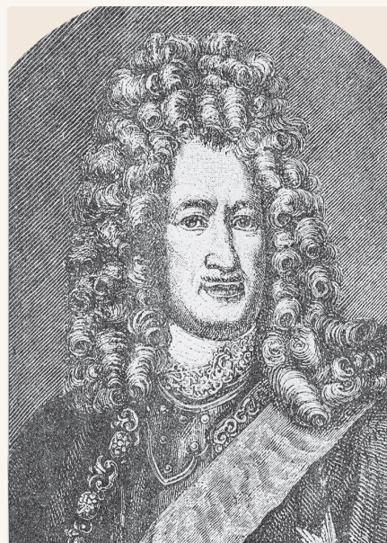
А. Д. Меншиков. Гравюра