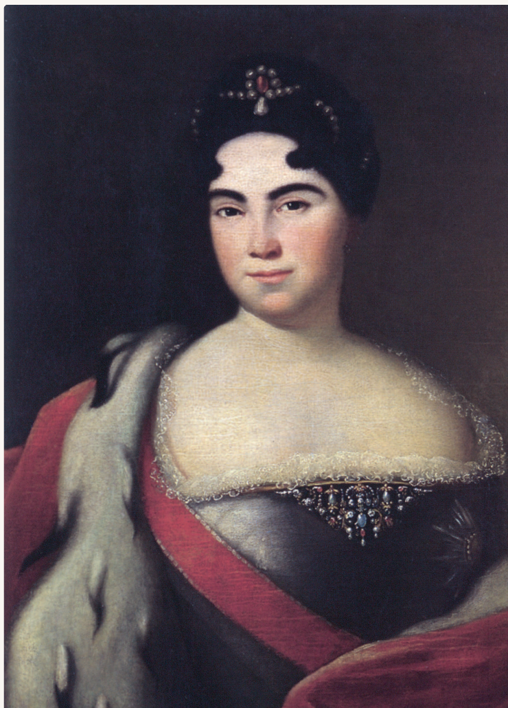
Императрица Екатерина I