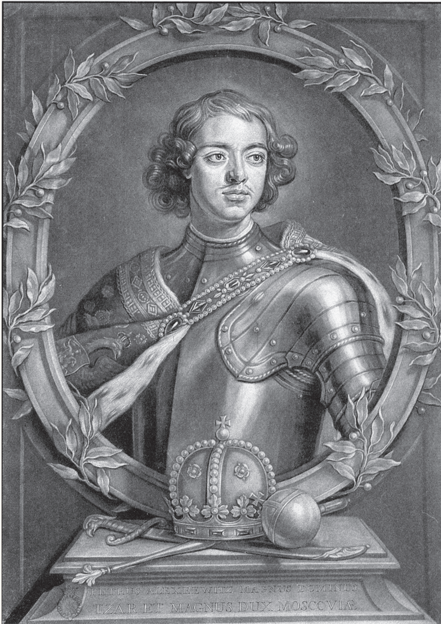
Император Петр. Гравюра

Петр искал утешения в Немецкой слободе 1 , в объездах Анны Монс 2 — дочери торговца, раскрепощенной и неглупой дамы, но так не могло продолжаться