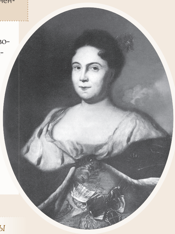
К. Моор. Портрет Екатерины

Екатерина отличалась неизменной приветливостью, покладистостью характера и врожденной тактичностью. Не обученная грамоте (письма к Петру писали за нее) и не особо разбиравшаяся в придворных интригах, она была преданна, обладала хорошим здоровьем. Однажды царь приказал своему денщику поднять на вытянутой руке тяжелый маршальский жезл, но тот не смог этого сделать. Тогда, как вспоминал современник, «его величество, зная, как сильна рука у императрицы, подал ей через стол свой жезл. Она встала и с необыкновенной ловкостью несколько раз подняла его над столом прямою рукою, что всех нас немало удивило».