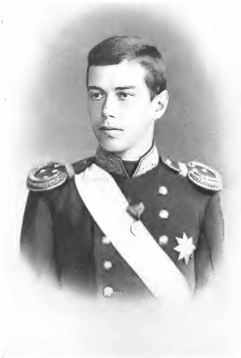
Наслѣдникъ Цесаревичъ Николай Александровичъ (1886 г.)

Изъ собранія Союза ревнителей памяти Императора Николая II.