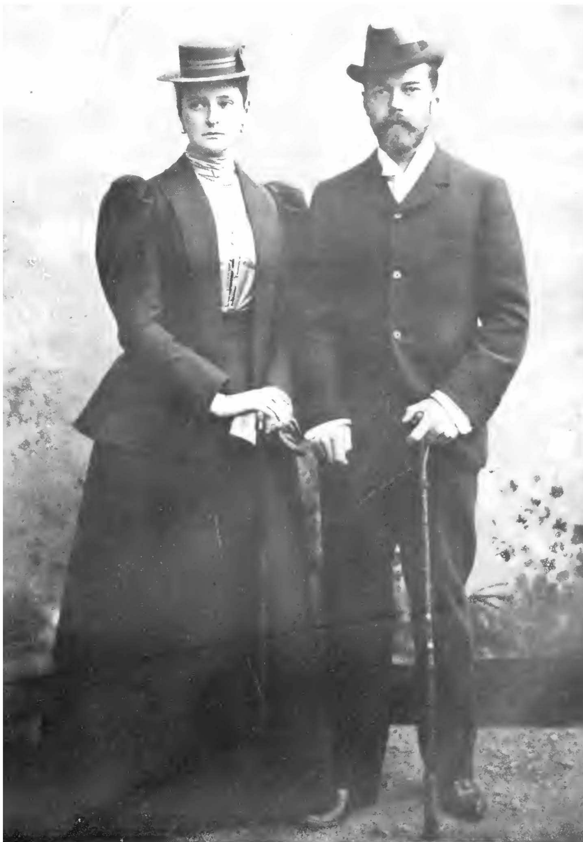
Наслѣдникъ Цесаревичъ Николай Александровичъ и принцесса Алиса Гессенская Виндзоръ, Июнь 1894 г.

Изъ собранія Союза ревнителей памяти Императора Николая II.