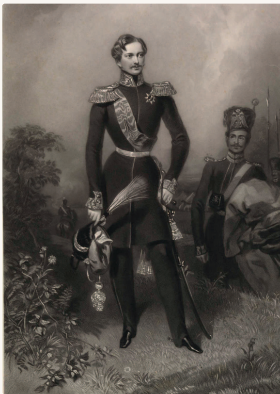
Александр II. Гравюра Альфреда Эдварда Шалона

В 1838 г. император Николай I отправил наследника в путешествие за границу. В Дармштадте цесаревич познакомился с принцессой Вильгельминой-Августой-Софьей-Марией. Юной девушке было всего пятнадцать лет, но родители принцессы с радостью благословили будущий брак своей дочери с наследником российского престола.