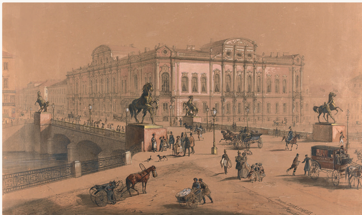
Вид на Аничков мост, 1859 г. Рисунок Шарлемана Иосифа Иосифовича (1824—1870)