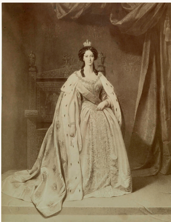
Мария Александровна. Отпечаток с фотографии Йозефа Альберта (1825—1886)