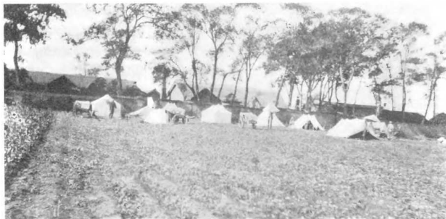
Бивуакъ, офицерскія палатки у д. Удіафаль.

принадлежали къ первому рангу, тогда какъ у японцевъ много было второго и третьяго ранговъ. Съ 1899 года мы приступили къ постройкѣ большого количества бронепалубныхъ крейсеровъ небольшого водоизмѣщенія, что можетъ быть объяснимо тѣмъ, что мы, готовясь къ войнѣ съ Японіей, хотѣли дать большое развитіе крейсерскимъ предпріятіямъ, для нанесенія наибольшаго вреда торговлѣ Японіи. Но, какъ только была рѣшена посылка 2-й тихоокеанской эскадры, послѣ этого намѣренія, всѣ сдѣланныя по этому приготовленія и распоряженія и даже ассигнованные кредиты пошли на смарку, произошла даже довольно смѣшная исторія съ пароходами Добровольнаго флота „Петербургъ“ и „Смоленскъ“. Съ самаго начала они были посланы для крейсерскихъ операцій и перехвата военной контрабанды и уже начали проявляться нѣкоторые результаты ихъ дѣятельности, но имъ пришлось возвратить захваченную ими добычу, а персоналу переносить всевозможныя оскорбленія и насмѣшки въ различныхъ портахъ, когда ихъ называли просто пиратами,—