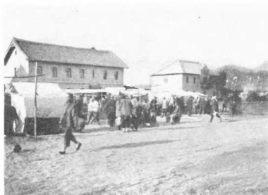
Лавочки у желѣзнодорожной станціи.

стенского, было выброшено и суда Небогатова не горѣли такъ, какъ костры, подобно другимъ судамъ нашей 2-й тихоокеанской эскадры. Въ бою цусимская эскадра была подраздѣлена на три отряда, подъ начальствомъ: Рожественскаго, Фелькерзама и Небогатова. Въ составъ перваго входили четыре однотипныхъ броненосца: „Бородино“, „Императоръ Александръ III-й“, „Фельдмаршалъ Суворовъ“ и „Орель“. Они обладали скоростью 16—18 узловъ и броня защищала весь корпусъ судна, орудія на всѣхъ были новыя и водоизмѣщеніе было 13.500 тоннъ, лишь на „Бородино“ машины оказались не вполне надежными. Во 2-й отрядъ — адмирала Фелькерзама—входили суда разнообразныхъ типовъ: броненосецъ „Ослябя“, построенный въ 1898 году, съ водоизмѣщеніемъ въ 13.000 тоннъ, на немъ было четыре 10-дюймовыхъ орудія и 11 скорострѣльныхъ 8-дюймовыхъ пушекъ, но онъ имѣлъ слабыя машины и бронировка его была не полная и слабая; эскадренный броненосецъ „Сисой Великій“ былъ построенъ въ 1894 году, съ водоизмѣщеніемъ въ 10.400 тоннъ, онъ имѣлъ скорость не болѣе какъ 12—14 узловъ, при чемъ лучше было бы его совсѣмъ не брать въ походъ или бросить въ какомъ-нибудь нейтральномъ порту, а не вести на вѣрную жертву неприятелю; затѣмъ слѣдовалъ эскадренный броненосецъ „Наваринъ“, еще болѣе старой постройки, 1891 года, водоизмѣщеніе было 9.500 тоннъ, артиллерія старая и скорость около 13 узловъ, кромѣ