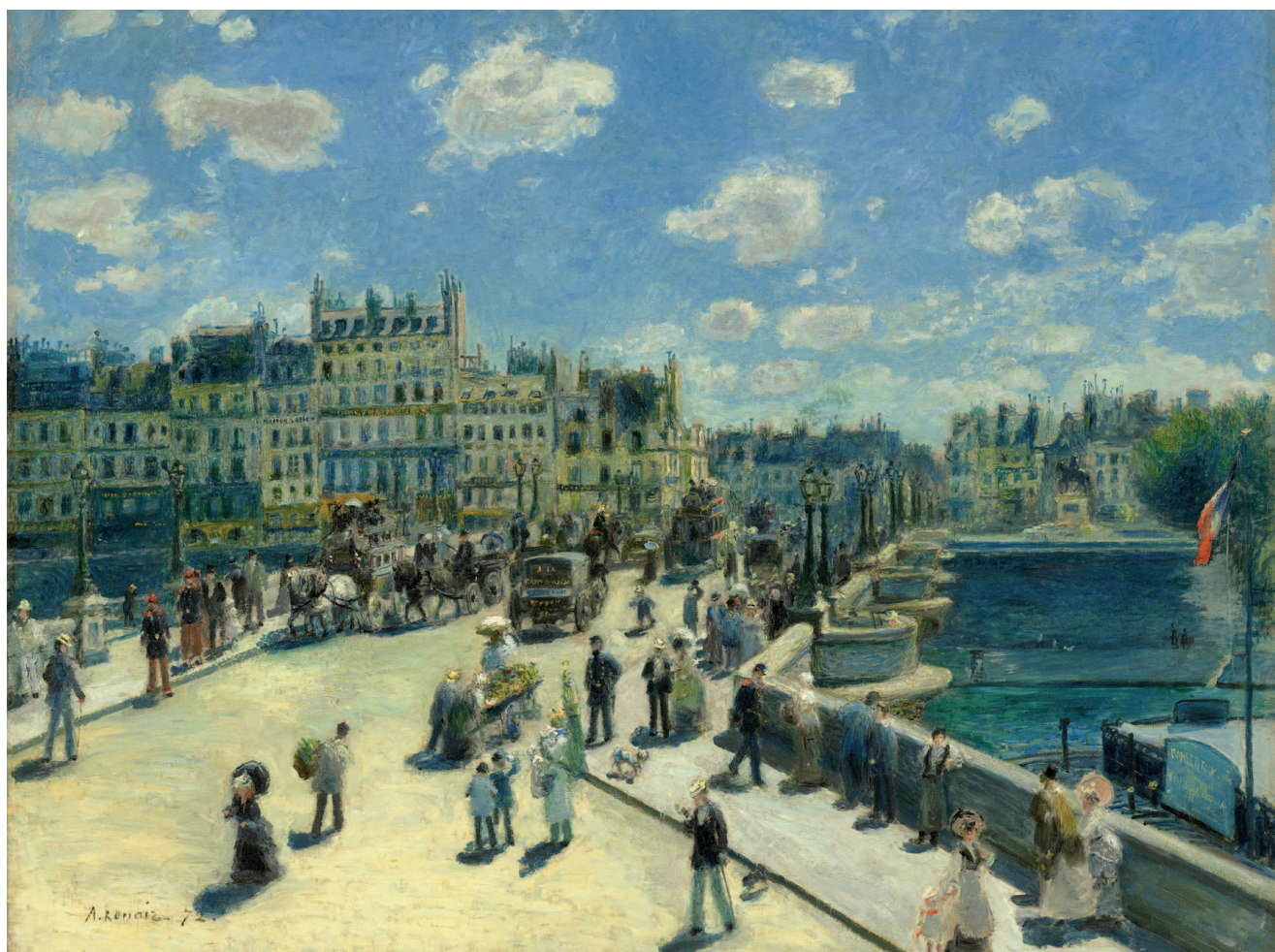
«Новый мост», 1872, холст, масло. Национальная галерея искусств, Вашингтон