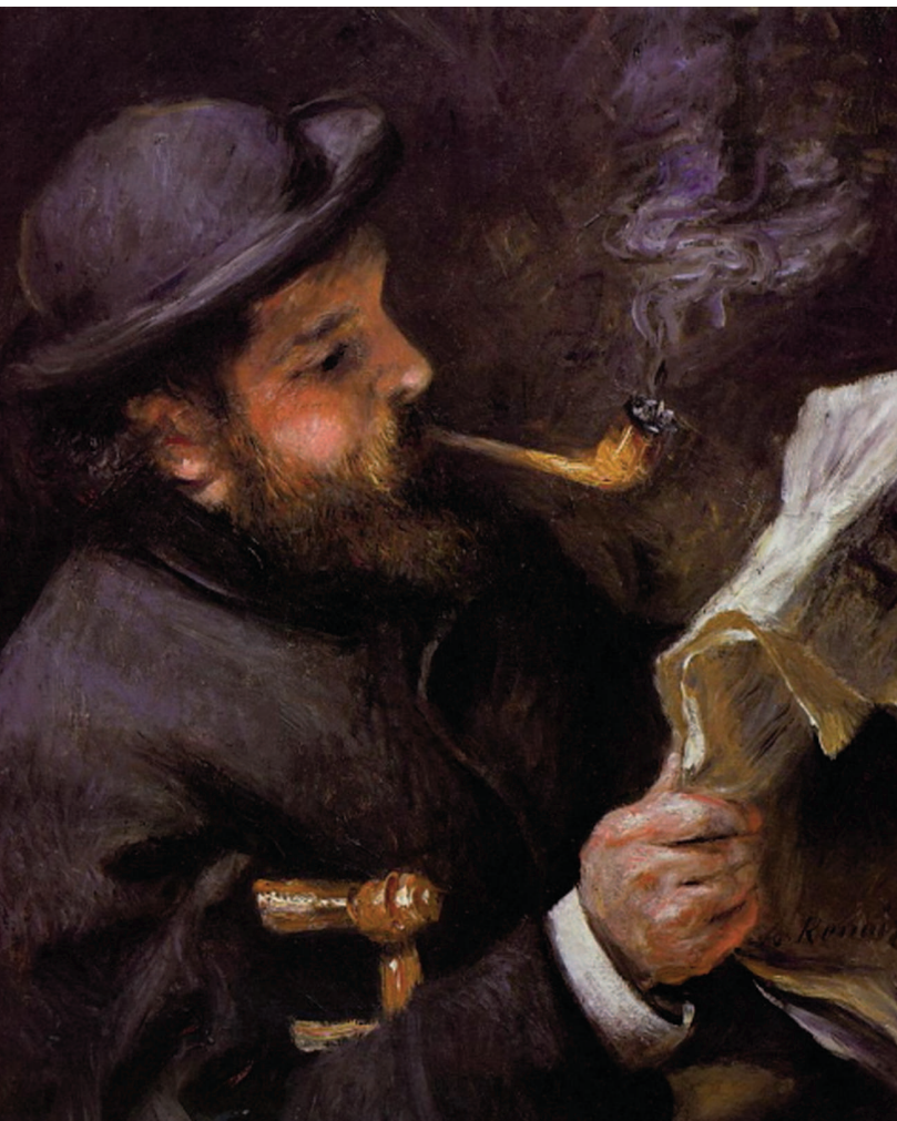
«Читающий Моне», 1872, холст, масло. Музей Мармоттан-Моне, Париж

знал свое отцовство официально, и Лиза, разорвав отношения, спустя несколько месяцев вышла замуж за одного молодого архитектора.