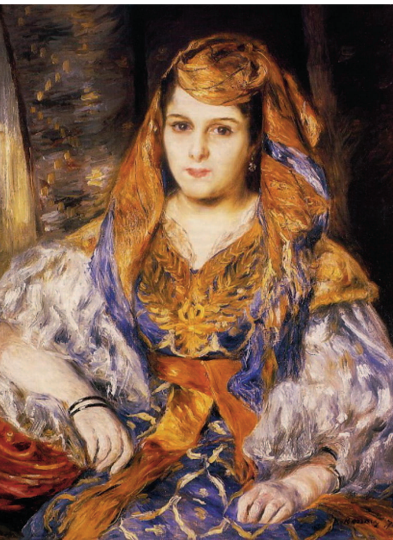
«Мадам Стора в алжирском платье», 1870, холст, масло. Музей изобразительных искусств, Сан-Франциско

Вскоре четыре молодых художника, к которым позже присоединился и Камиль Писсарро, сдружились и стали искать пути выхода из узких рамок академизма. Это удавалось им с большим трудом, поскольку успех любого начинающего художника в те годы напрямую зависел от признания Салона, жюри которого всегда отличалось крайним консерватизмом.