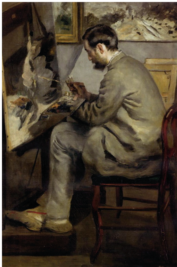
«Фредерик Базиль», 1867, холст, масло. Музей д'Орсэ, Париж

Однако семье вечно не хватало денег, а потому Ренуар был вынужден забыть о музыкальном поприще. Вместо этого он получил ремесленное образование и в возрасте тринадцати лет занялся росписью фарфора. Вскоре он даже начал за-