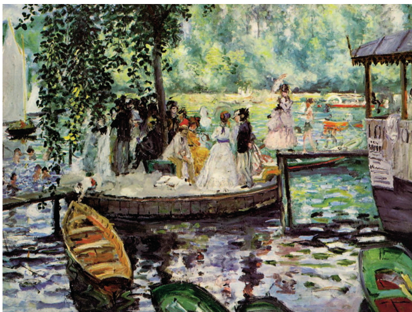
«Лягушатник», 1869, холст, масло. Национальный музей Швеции, Стокгольм

В 1862 году, успешно сдав экзамены в Школу изящных искусств при Академии художеств, Ренуар поступил в мастерскую Шарля Глейра, в которой познакомился с тогда еще никому не известными Клодом Моне, Альфредом Сислеем и Фредериком Базилем.