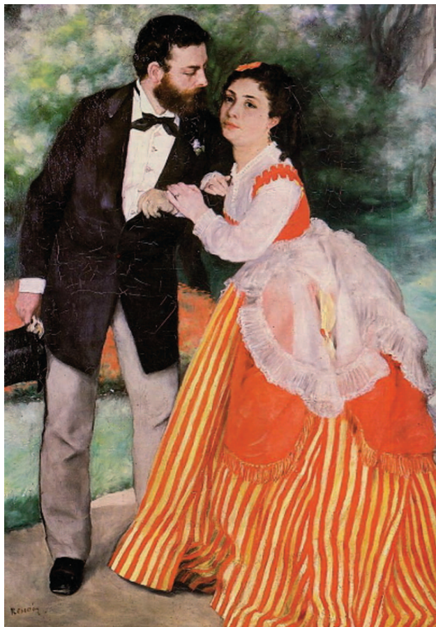
«Портрет А. Сислея с женой», 1868, холст, масло. Музей Вальрафа-Рихарца, Кёльн

Энгр и Делакруа, ведущие французские живописцы первой половины XIX века, являлись представителями двух противополоствующих школ: академической и романтической. Новаторский подход Делакруа долгое время осуждался сторонниками подхода академического, обвинявшими художника в чрезмерном натурализме.