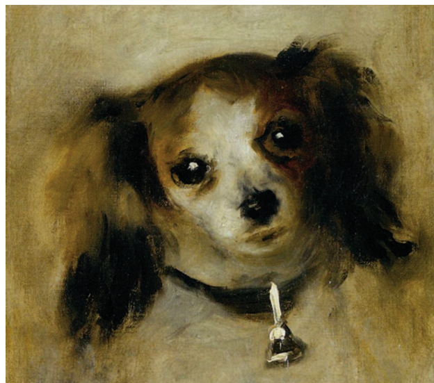
«Голова собаки», 1870, холст, масло. Национальная галерея искусств, Вашингтон

Художественная молодежь Франции 1860-х годов увлекалась реализмом и находилась под определенным влиянием Густава Курбе, основателя реалистической школы, и барбизонцев, группы художников-пейзажистов, которые, разочаровавшись вследствие постоянных неудач в Салоне, обосновались в крохотной деревушке Барбизон в лесу Фонтенбло, где свободно работали, не ориентируясь больше на мнения мэтров.