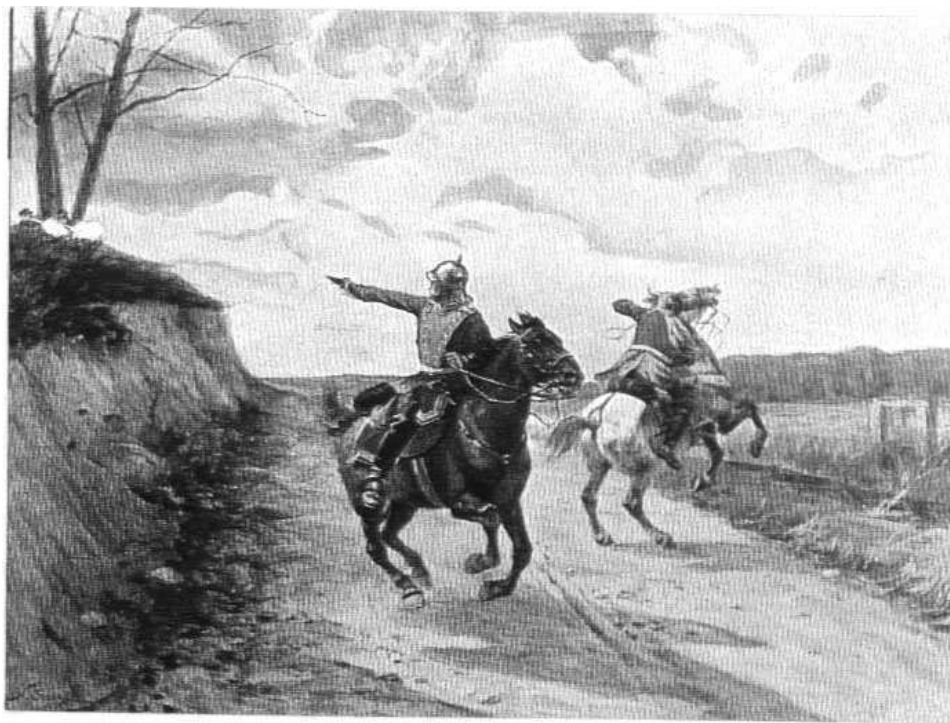
Встрѣча нѣмецкаго разъѣзда съ русскимъ дозоромъ

Всех веселит выступление мароккского султана, друга Франции, объявившего себя в войне с Германией и выгнавшего от себя ее