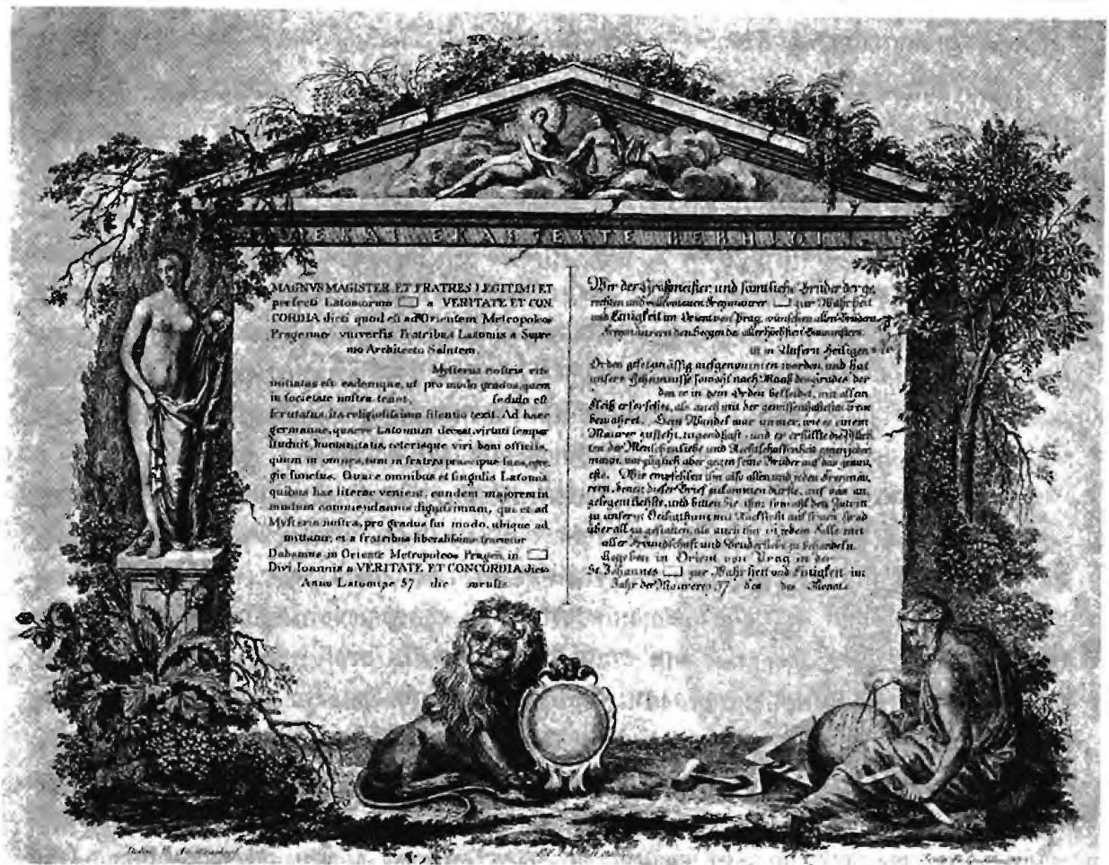
Масонская грамота. (Нац. библ. въ Парижѣ). Diplôme maçonnique.