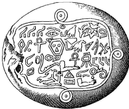
Изъ «Surles inconnus» 1777.