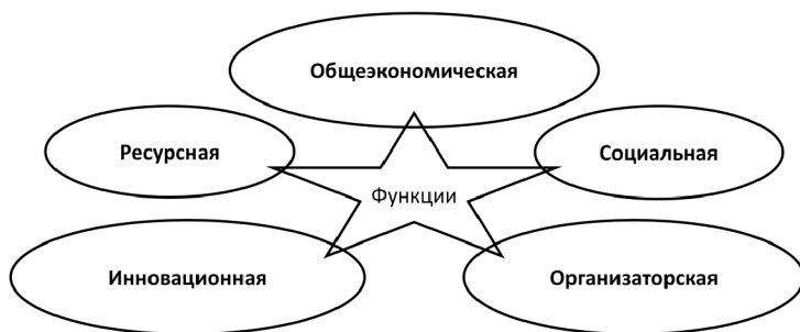
Рис. 1.2. Основные функции предпринимательской деятельности

Общэкономическая функция заключается в развитии производства товаров (работ, услуг) и их доведении до конкретных потребителей в условиях системы рыночной экономики, которая предопределяет общественный характер труда и продукта. Существенную роль в реализации этой функции играет самостоятельность предпринимателя в выборе правовых форм организации производства и систем управления производством, выбор форм реализации и обмена продукции, анализ динамики спроса и предложения и на этой основе удовлетворение общественных потребностей.