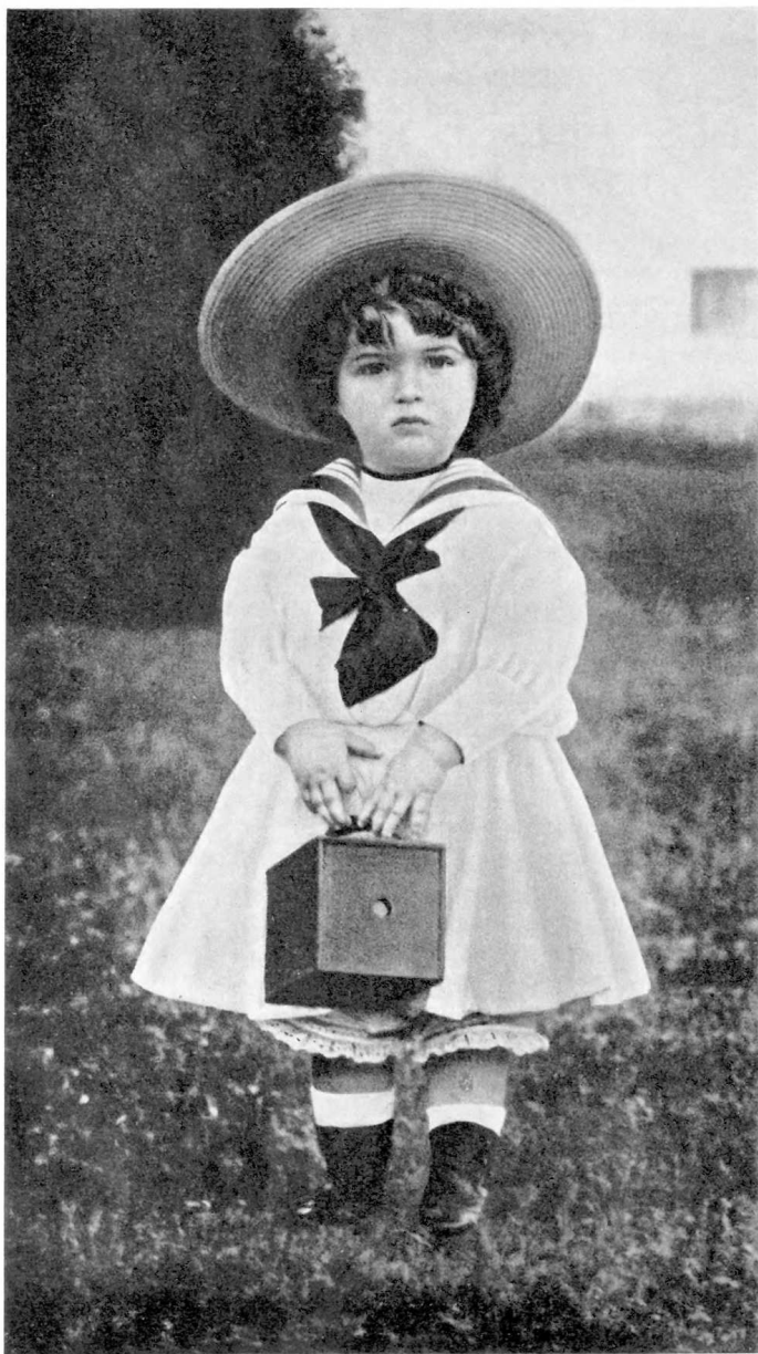
ЕГО ИМПЕРАТОРСКОЕ ВЫСОЧЕСТВО НАСЛѢДНИКЪ ЦЕСАРЕВИЧЪ И ВЕЛИКІЙ КНЯЗЬ АЛЕКСІЙ НИКОЛАЕВИЧЪ. Крестникъ Манѣжурскихъ армій.