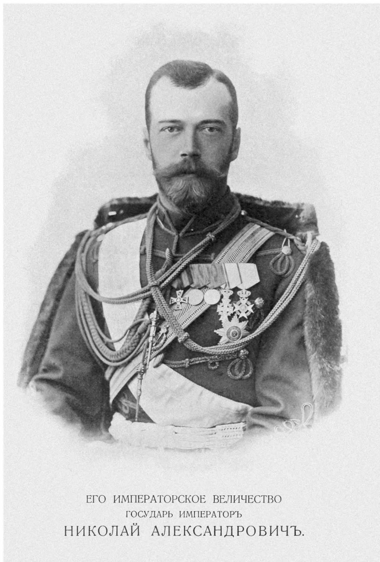
ЕГО ИМПЕРАТОРСКОЕ ВЕЛИЧЕСТВО ГОСУДАРЬ ИМПЕРАТОРЪ НИКОЛАЙ АЛЕКСАНДРОВИЧЪ.