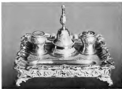
Серебряная чернильница раб. XVIII столѣтїя, находящаяся на столѣ присутствїя Общаго собранїя Сената.

Для присутствія Сената сдѣлана была великолѣпная чернильница, на которую пошло серебра 3 ф. 80 зол., да на позолоту до 6 золотыхъ. Изъ свидѣтельства купечской палаты видно, что чернильница сдѣлана была мастеромъ Артемьевымъ съ чернью, изящно, „самымъ добрымъ мастерствомъ“ 1) .