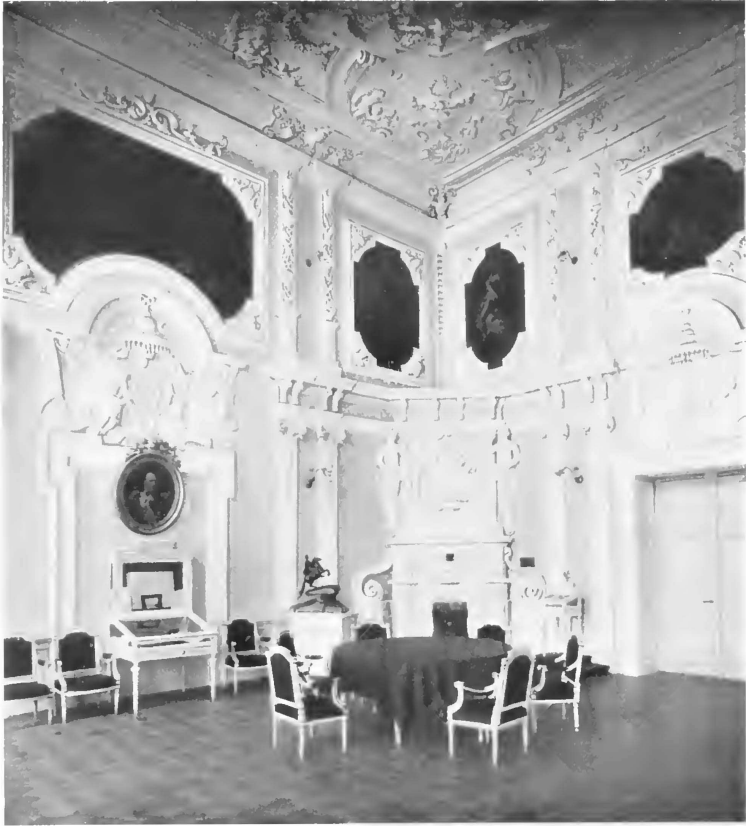
Залъ Петра I въ зданіи Императорскаго С.П.Б. университета, бывшемъ зданіи коллегій.

тельствующаго Сената и всѣхъ коллегій и канцелярій позади ихъ построенную галерею въ два апартамента штукатурною работою, а именно: съ лица и изнутри подмазать сѣрою известью подъ