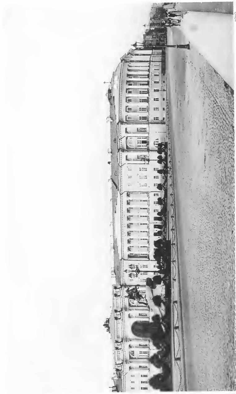
ЗДАНИЕ ПРАВИТЕЛЬСТВУЮЩАГО СЕНАТА.