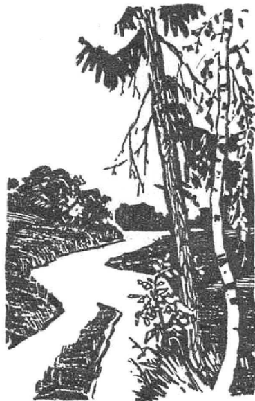
Рисунки В. РАССОХИНА.

Я часто теперь повторяю себе, Исчеркивая тетрадь, Что новые силы берутся в борьбе, Что время нельзя терять И тысячу раз в своем счастье права Сквозь камни пробившаяся трава.