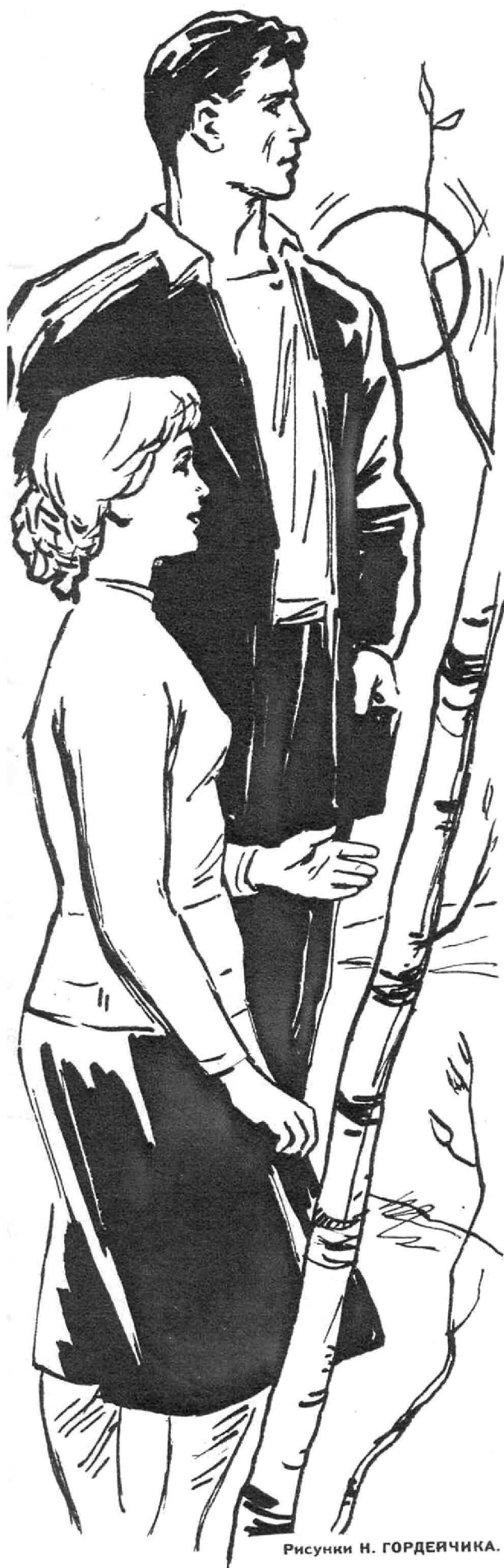
Рисунки Н. ГОРДЕЯЧКА.