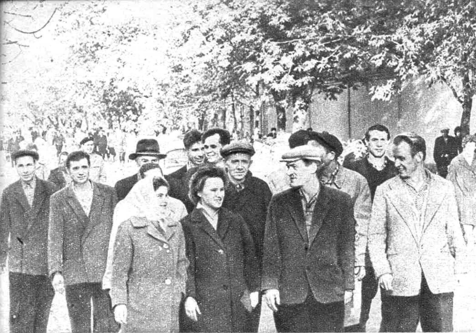
Рабочая смена шагает по улице Баррикад. На переднем плане группа рабочих фаннолитейного цеха завода «Красное Сормово».