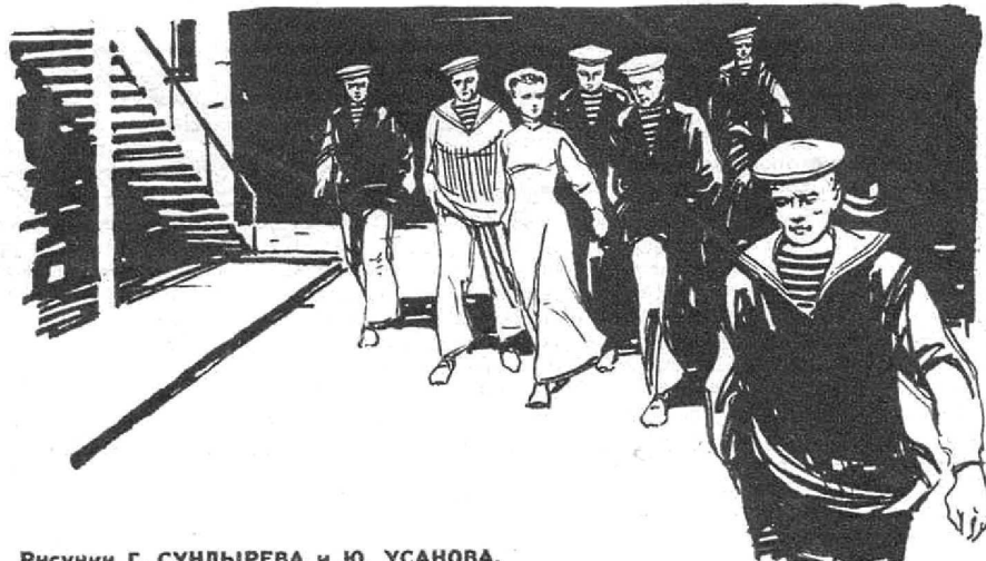
Рисунки Г. СУНДЫРЕВА и Ю. УСАНОВА.

Гордый флаг «Очакова» был расстрелян. Царизм задушил восстание черноморцев. Но он бессилен был повернуть вспять историю. Несколько месяцев спустя Ленин писал в статье «Перед бу-