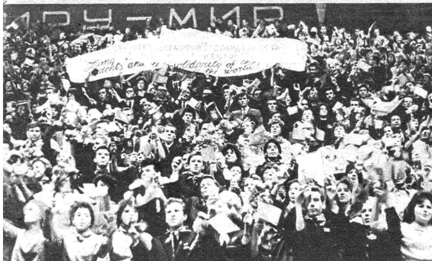
Во Дворце спорта встретились молодые москвичи и делегаты форума. Слова «мир» и «дружба» не требуют перевода...