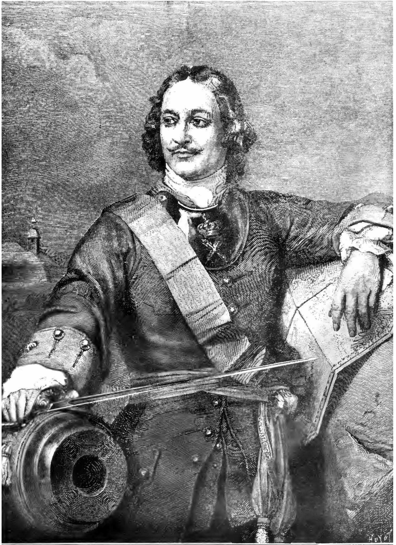
ИМПЕРАТОРЪ ПЕТРЪ ВЕЛИКІЙ