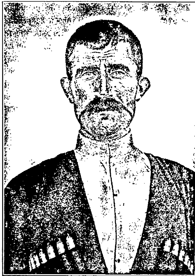
Рис. 2. Карачаевецъ изъ Учкулана. 33 лѣтъ (№ 33 табл. измѣреній).

Преданія карачаевцевъ говорятъ о происхожденіи ихъ слѣдующее. Лѣтъ 500 тому назадъ нѣкто Карча съ четырьмя товарищами: Будіяномъ, Наурузомъ, Адурхаемъ и Трамомъ, и кучкою ихъ приверженцевъ выселился изъ Крыма. Причиной выселенія одни называютъ междоусобицу, другіе—покореніе крымцевъ какимъ-то другимъ народомъ. Карча отличался храбростью и предприимчивостью и, благодаря этимъ качествамъ, всталъ во главѣ эмигрантовъ. Передвигаясь на востокъ вдоль берега Чернаго моря, они поселились сперва гдѣ-то въ Абхазіи, въ мѣстности, которую называютъ то Джеметей, то Иналь-куба. Однако, ихъ