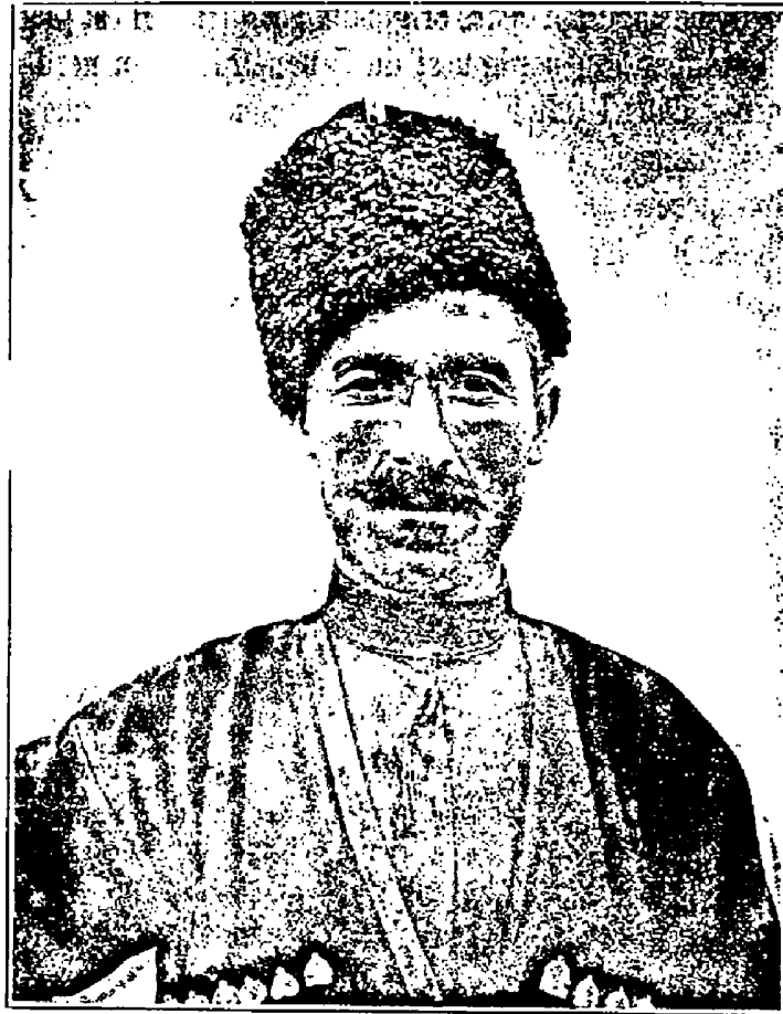
Рис. 3. Карачаевецъ изъ Учкулана, 35 лѣтъ

Что же за народъ составлялъ это прежнее населеніе и когда онъ могъ отсюда исчезнуть? Нѣкоторые факты заставляютъ предполагать, что это были аланы, которыхъ, какъ это было установлено изслѣдованіями проф. Миллера 1) , нужно