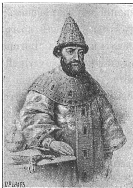
Царь Михаилъ Феодоровичъ.