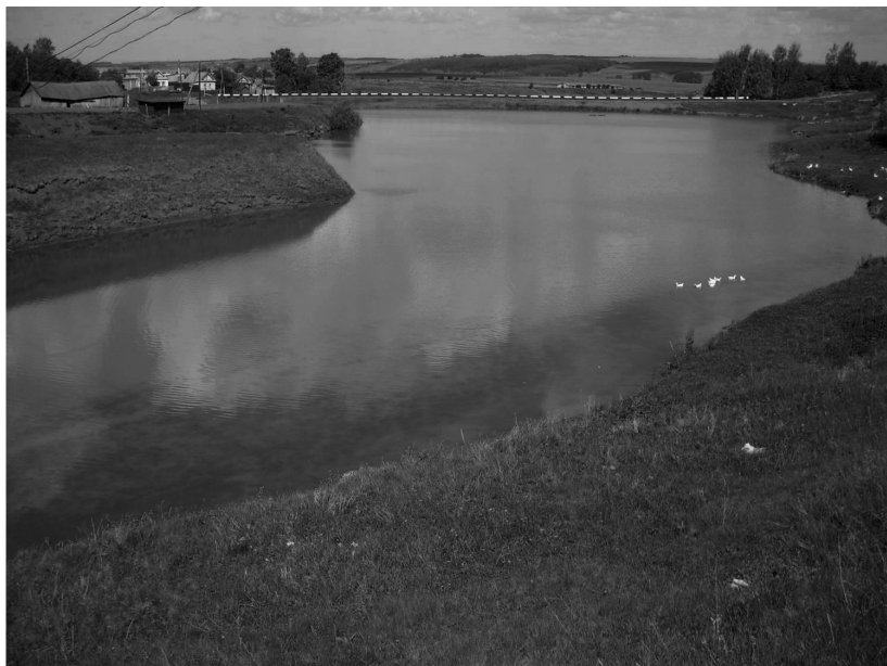
Пруд Праски Кўлли.

Тут, наверно, Азамат 2 Потрудился без растрат. Он благое сделал дело: Мост построил 3 , в самом деле.