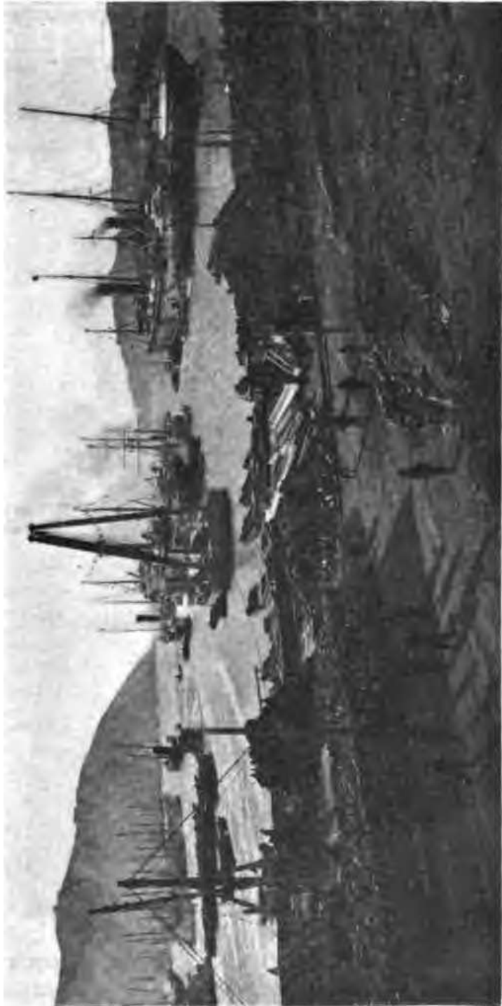
Торговая гавань Портъ-Артура въ мирное время.

шую любоваться окружающими это, въ высшей степени интересное озеро снѣжными вершинами, а также забыть негодование всѣхъ и каждого на то,