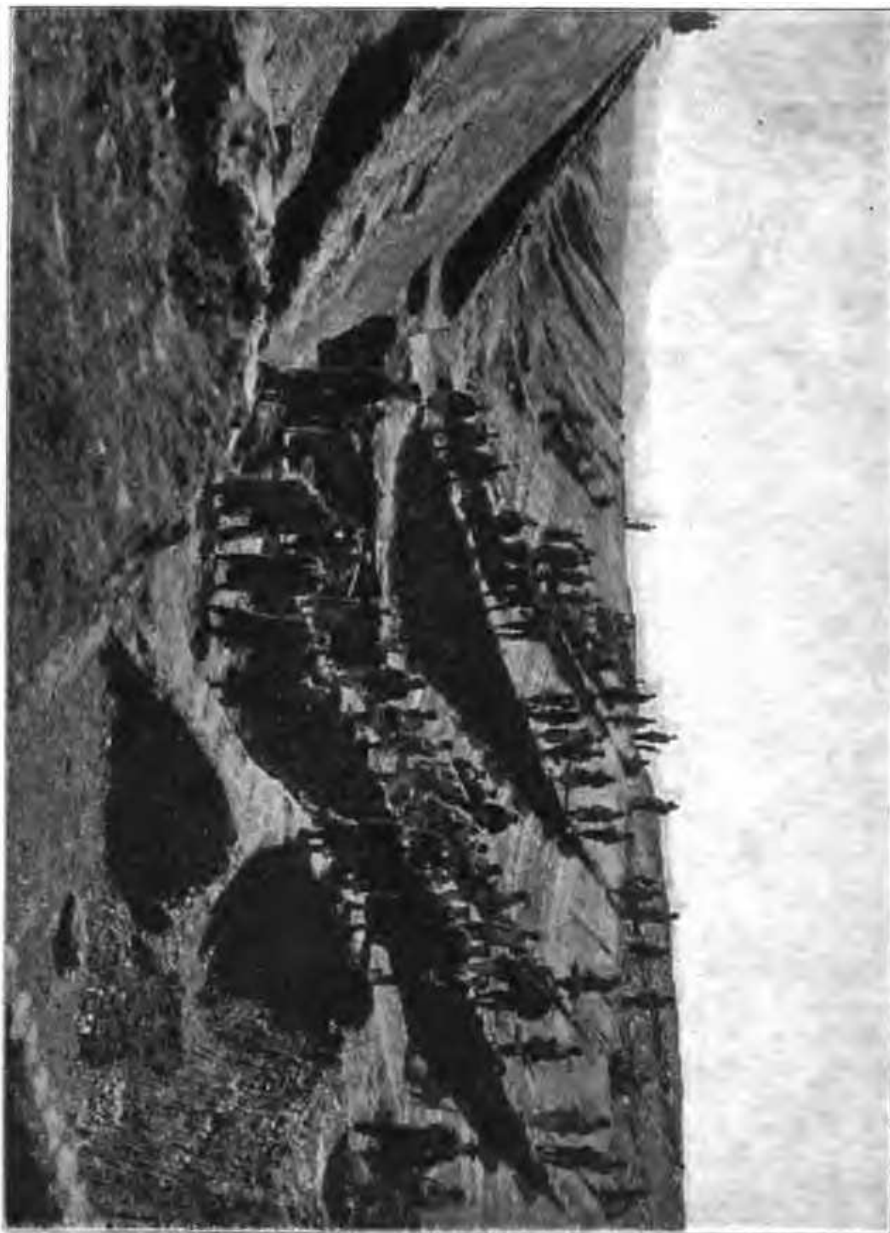
Работы по постройкѣ Китайской Восточной желѣзной дороги.

тельными лѣсными пожарами на склонахъ горъ вблизи Байкала — этимъ бичемъ нашихъ богатыхъ лѣсами окраинъ, — плодомъ нашей преступной неосторожности, что, въ свою очередь, можетъ быть объяснено тѣмъ, что всѣми этими богатствами владѣетъ казна, ея чиновники, а не само населеніе, въ интересахъ котораго экономно расходовать эти богатства, заботиться о сохранности ихъ.