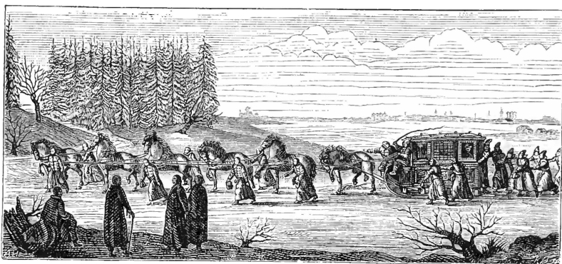
Поѣздъ знатной русской боярыни въ XVII столѣтіи.

Первый рисунокъ изображаетъ зимній поѣздъ знатной русской боярыни. Тяжелый, массивный возокъ тянется по глубокому снѣгу шестью лошадьми, запряженными «гусемъ». Толпа раболѣпныхъ