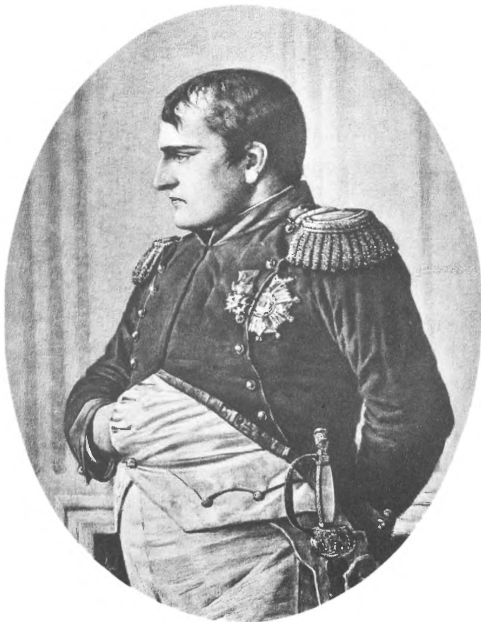
Въ ожиданіи мира. Съ картины В. В. Верещагина.