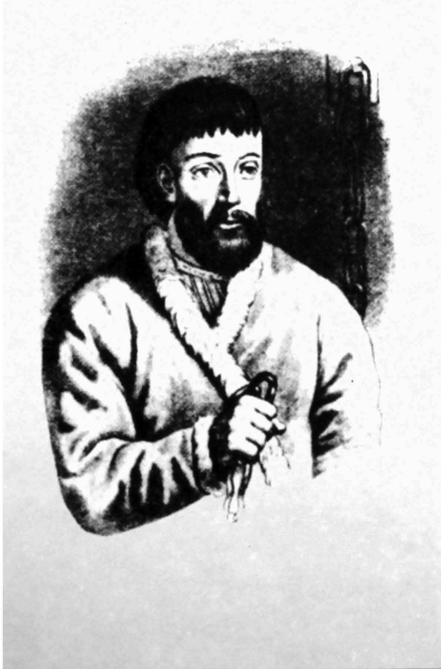
Е. И. Пугачев в тюремной камере в дни следствия над ним осенью 1774 года Гравюра впервые воспроизведена А. С. Пушкиным в книге «История Пугачевского бунта» (СПб., 1834).