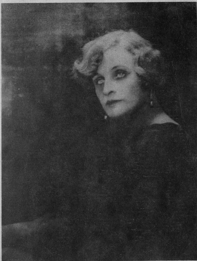
НАДЕЖДА АЛЕКСАНДРОВНА ТЭФФИ

Шлю Вам самый сердечный привет и пожелания успеха.