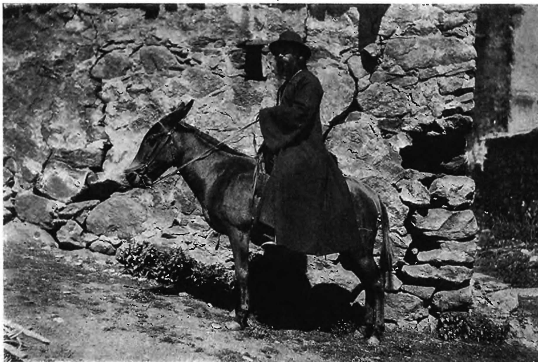
Священникъ верхомъ на катерѣ объѣзжаетъ свою паству въ одномъ изъ округовъ въ Закавказьѣ.

тивленіе. Чѣмъ дальше отходили австрійскія войска въглубу Западной Галиціи, обнажая правый флангъ линіи германскихъ войскъ, тѣмъ яростнѣе становились атаки германцевъ на Пилицѣ, Равкѣ и Бэурѣ и 18 декабря онѣ слились въ общее наступленіе германцевъ на весь фронтъ отъ нижняго теченія Вислы до Ниды. Чтобы придать ему сокрушительный характеръ, германцы сосредоточили все, что могли изъ своихъ резервовъ, и подвезли даже знаменитыя 42-хъ сантим. орудія. Наступленіе это захватило также и районъ Восточной Пруссіи. Оно велось на слѣдующихъ направленіяхъ и фронтахъ: 1) на линіи Мазурскихъ озеръ въ районѣ