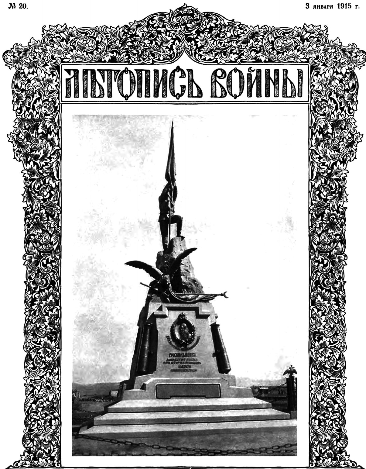
Карсѣ. Памятникъ взятія Карса 6 ноября 1877 г.