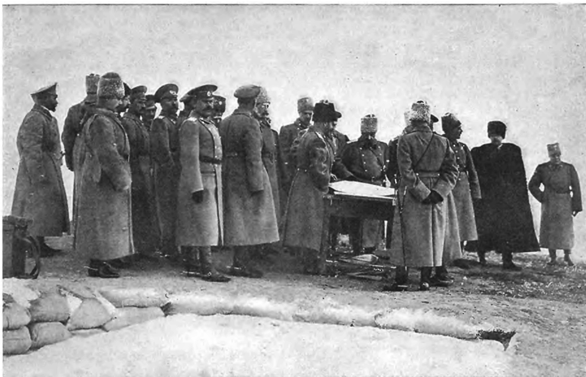
Карсѣ. 1 декабря 1914 г. Его Императорское Величество Государь Императоръ на одномъ изъ фортѣвъ крѣпости выслушиваетъ докладъ отъ коменданта крѣпости. (Перепечатка воспрещается).