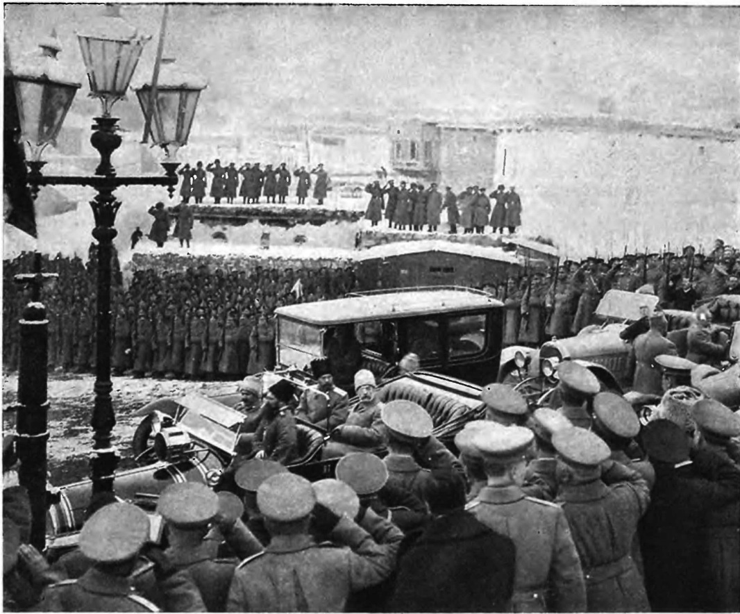
Карскъ. Прибытіе Его Императорскаго Величества Государя Императора въ Карскій военный соборъ 30 ноября 1914 г.