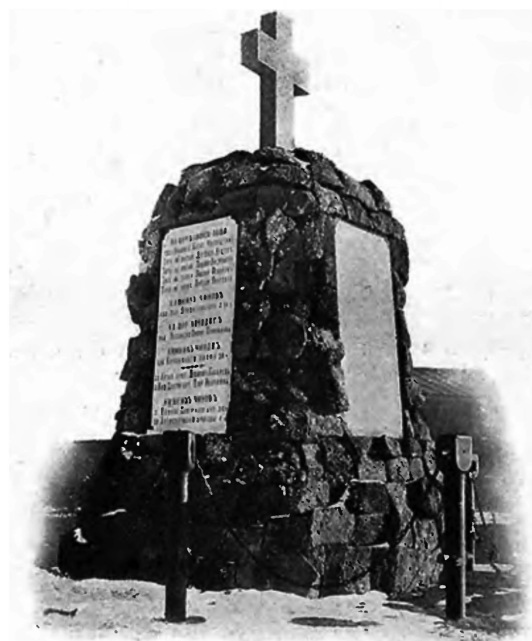
Памятникъ на братской могилѣ нашихъ воиновъ, павшихъ въ 1877 г. при взятіи Карса.

Великая радость, великое счастье, великая слава Россіи и ея дивной арміи.