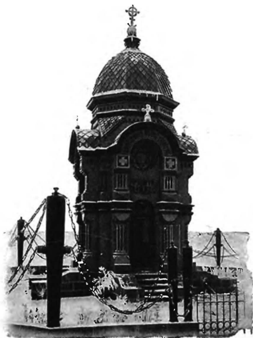
Часовня въ Карсѣ въ память взятія его нашими войсками въ 1877 г.

На театрѣ войны съ Турціей военныя дѣйствія по прежнему развивались въ направленіяхъ Ольтинскомъ и Сарыкамышскомъ и къ нимъ прибавилось еще направленіе Ардаганское. На первомъ изъ нихъ наши войска, перейдя рѣку Лауреницъ, остановили наступленіе турокъ, а затѣмъ сами перешли въ таковое и заняли Мерденскъ. 19 декабря въ этомъ направленіи боковыхъ столкновений уже не было. Болѣе энергично дѣйствуютъ турки на Сарыкамышскомъ направленіи, на которомъ они сосредоточили значительныя силы, и, занявъ сел. Верхній Сарыкамышъ, упорно обороняли его въ теченіе 14, 15 и 16 декабря. 17 числа мы, обстрѣлявъ это селеніе артиллерійскимъ огнемъ, атаковали его и на-