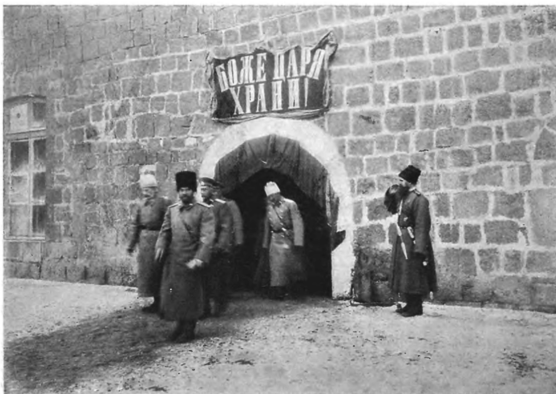
Карсѣ. 1 декабря 1914 г. Его Императорское Величество Государь Императоръ обходитъ помѣщенія крѣпостного гарнизона. (Перепечатка воспрещается).