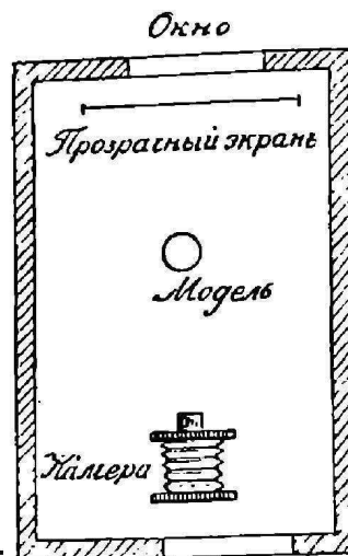
Дверь Рис. 3.

графирования при искусственном свѣтѣ, а на рис. 5 полученный силуэтъ.