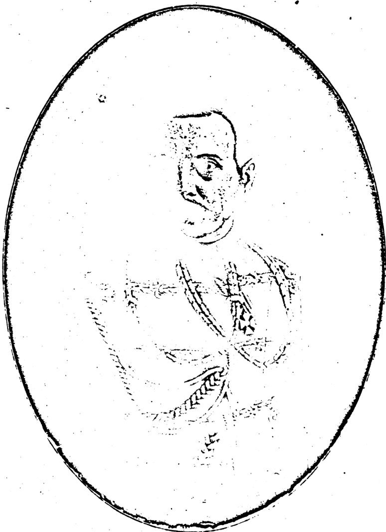
Государь Императоръ Александръ II.