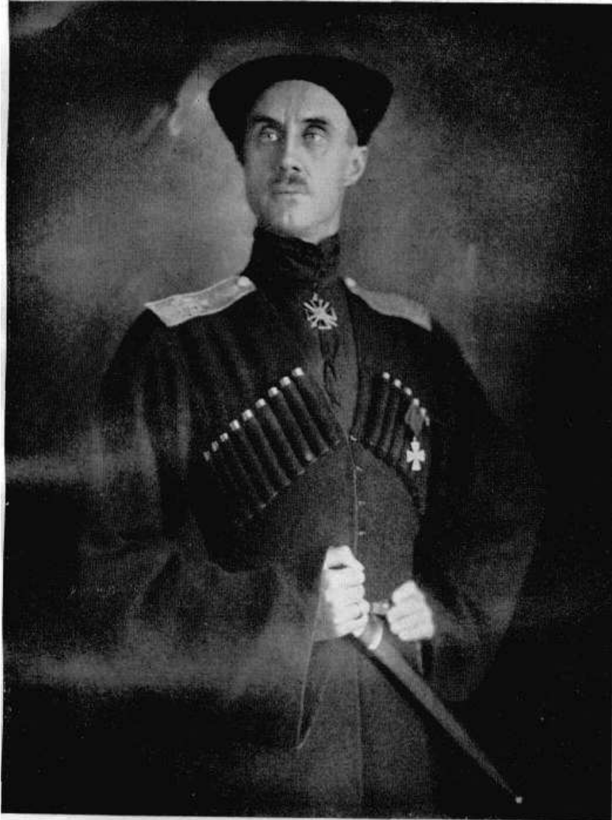
Главнокомандующий Русской Армией Генераль Баронъ Петръ Николаевичъ Врангель.