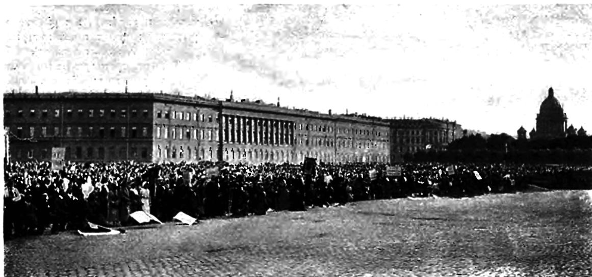
На площади передъ Зимніймъ Дворцомъ въ день объявленія войны, 20 іюля 1914 г.

Австрійцамъ нужно было перессорить между собою славянъ, начинавшихъ было дѣлать плоды завоеваній,— чтобы бить ихъ ихъ-же оружіемъ.