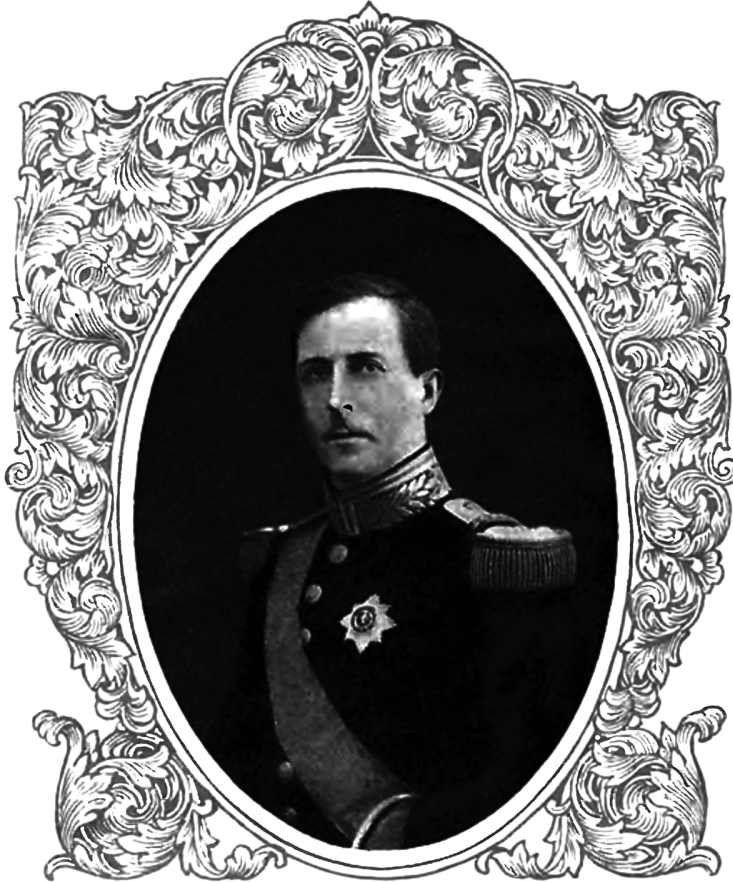
ЕГО ВЕЛИЧЕСТВО КОРОЛЬ БЕЛЬГИИ А ЛЬБЕРТЪ.

манило нѣмцевъ и австрійцевъ къ славянскимъ землямъ. Зная, что Россія, вѣковая покровительница славянства, не позволитъ безъ боя поглотить славянскія народности, съ одной стороны, а съ другой — не желая рисковать въ единоборствѣ съ побѣдоносными русскими суворовскимъ орлами, Германія и Австрія, заявляя вслухъ о необходимости соблюденія въ Европѣ политическаго равновѣсія, втайнѣ неуспешно вели антиславянскую политику. По ихъ нашенстванію Турція прижимала балканскихъ славянъ и, чувствуя за сѣбною поддержку, вызывающе вела себя по отноше-