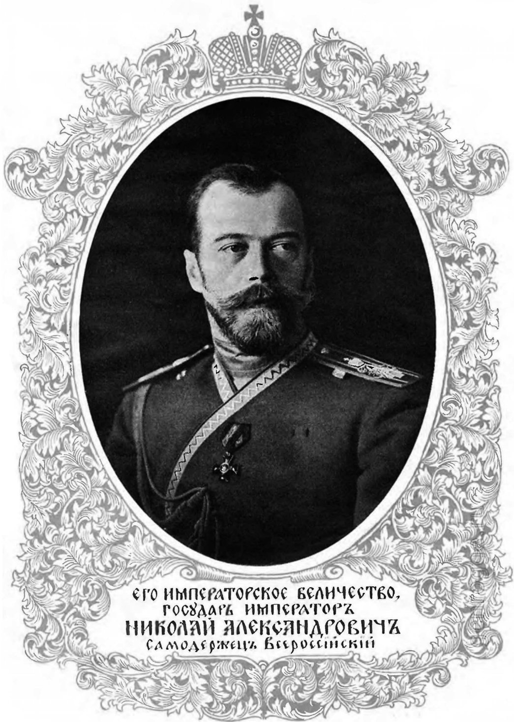
ЕГО ИМПЕРАТОРСКОЕ ВЕЛИЧЕСТВО, ГОСУДАРЬ ИМПЕРАТОРЪ НИКОЛАЙ АЛЕКСАНДРОВИЧЪ САМОДЕРЖЕЦЪ ВСЕРОССИЙСКІЙ