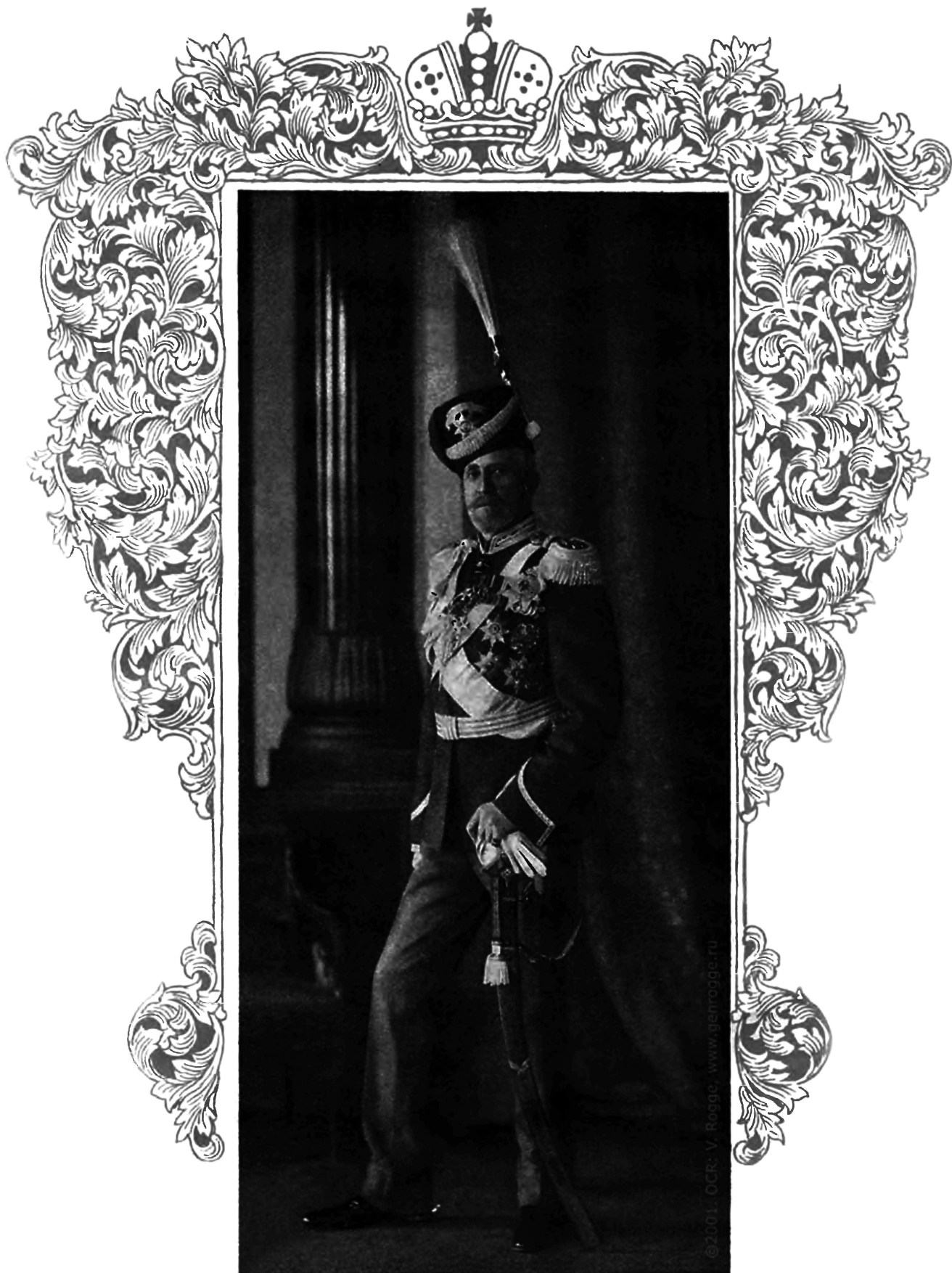
ЕГО ИМПЕРАТОРСКОЕ ВЫСОЧЕСТВО ВЕРХОВНЫЙ ГЛАВНОКОМАНДУЮЩИЙ ВЕЛИКИЙ КНЯЗЬ НИКОЛАЙ НИКОЛАЕВИЧЪ.