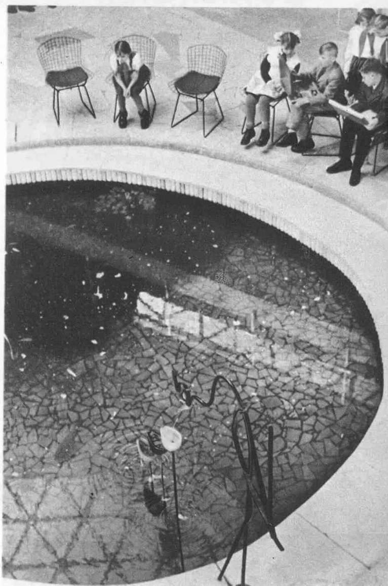
У фонтана «Аист».