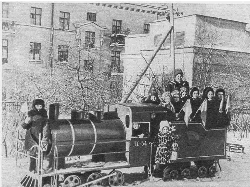
«Мы едем, едем, едем в далекие края...» — поют малыши, отправляясь «в дальние путешествия». Этот паровоз подарили детскому саду № 54 рабочие цеха улавливания.