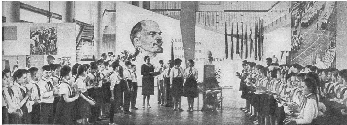
Отряды выстроились на торжественную линейку.