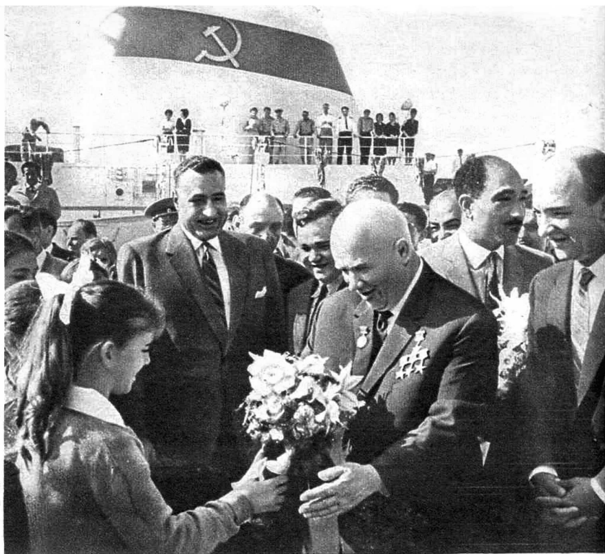
Н. С. Хрущев и Гамаль А. Насер прибыли в Александрийский порт.