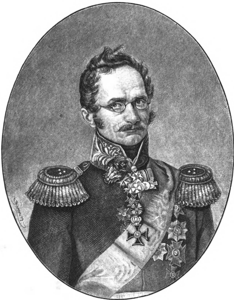
АЛЕКСАНДРЪ ИВАНОВИЧЪ МИХАЙЛОВСКІЙ-ДАНИЛЕВСКІЙ ро.д. 1790 † 1848.