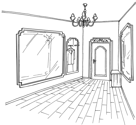
Рис. 1. Просторная прихожая в классическом стиле

Для отделки помещений характерно использование огромных зеркал, ниш и экранов, по периметру выложенных молдингами, которые органично смотрятся только в больших помещениях правильной формы (рис. 1).