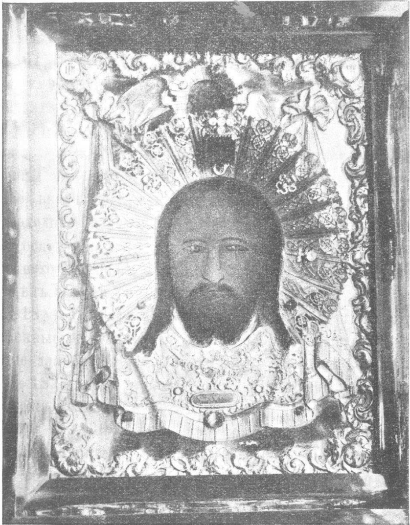
Икона Нерукотвореннаго Спаса въ Алатырскомъ Свято-Троицкомъ монастырѣ.